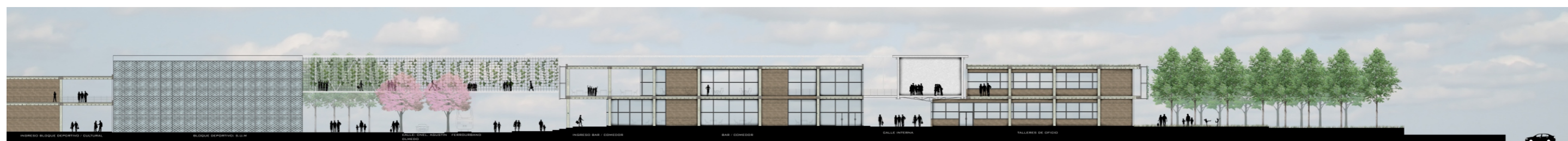
CORTE C-C escala: grafica