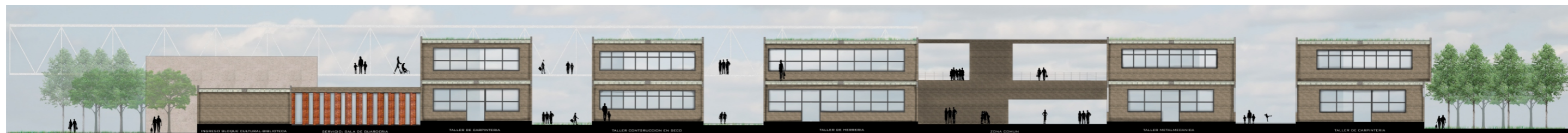
CORTE B-B escala: grafica