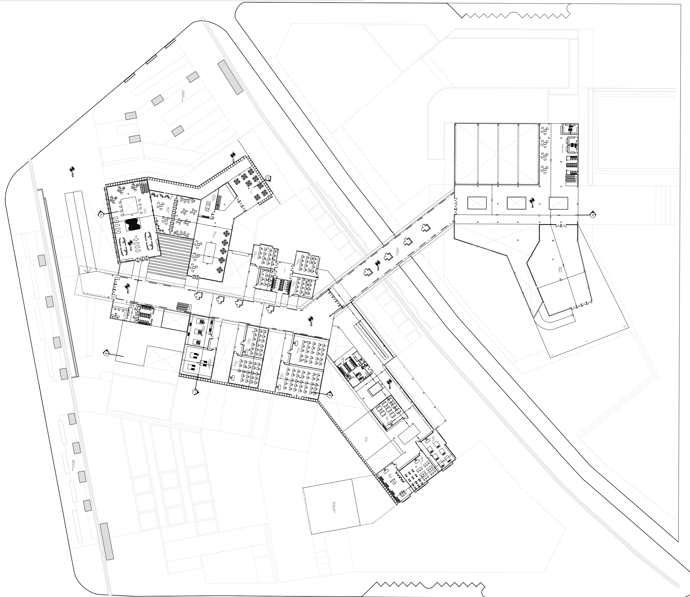
PLANTA ALTA ESCALA: GRÁFICA