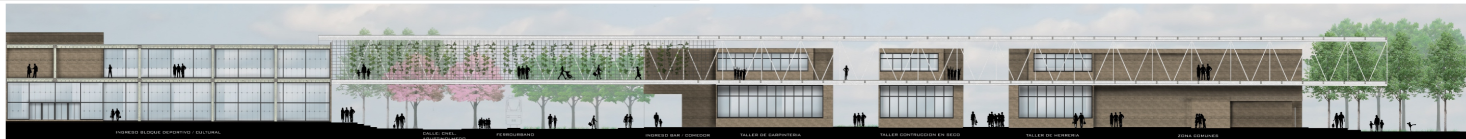
CORTE A-A escala: grafica