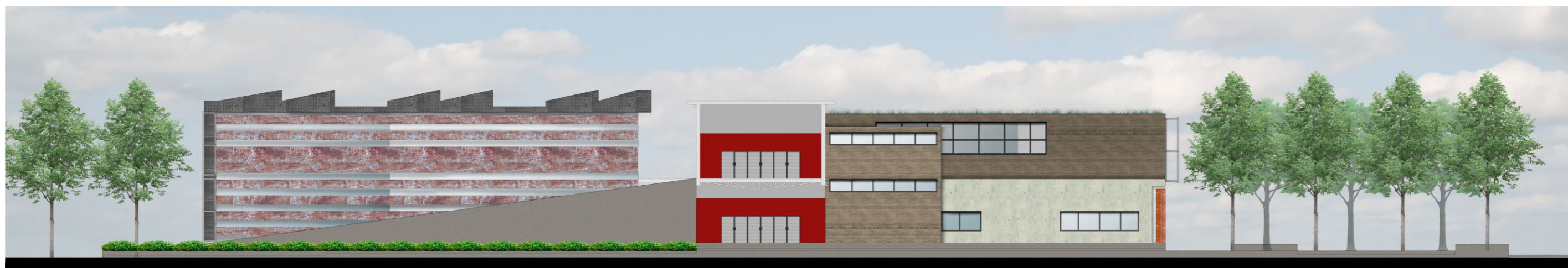
VISTA FRONTAL escala: grafica