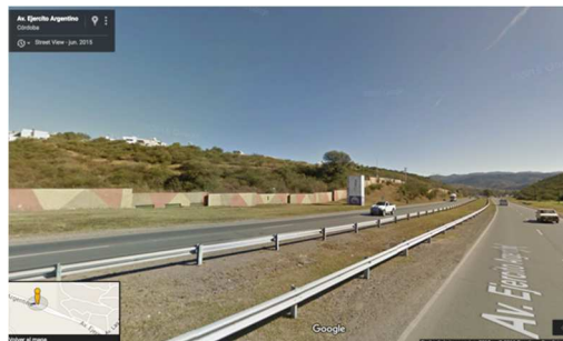
Figura 7 Borde Urbanización La Cuesta.

Este caso posee otra arista que esta presentación quiere poner en consideración: el diseño de los bordes que colindan con las vías de acceso. En el caso de La Cuesta, el borde sobre la Av. Ejército argentino incorpora un muro de paneles pre moldeados que recorre toda la extensión del Barrio. (Fig. 7). La Estanzuela, por su parte, resuelve el borde con el barrio con un cerco alambrado perimetral que impide la libre circulación sobre calles públicas.