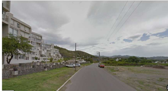
Figura 9. Borde sobre calle pública La Estanzuela, La Calera.

En este sentido se propone que se incorporen viviendas de interés social en estos bordes que de otra manera solo contribuyen a ahondar la fractura social y a la degradación y abandono del espacio público.