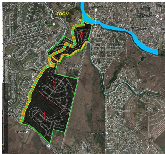
Figura 4. Programa apertura y rediseño del borde sobre el afluente del Suquia.

Las falencias detectadas en el ejercicio del contralor de los diversos estamentos de gobierno son las que nos dan el primer indicio de cómo mitigar los efectos. Nos referimos que es el