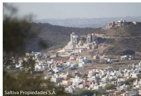
Figura 5. Urbanización La Cuesta. Fuente: MiTerra, 2007

Hacia los años dos mil, el fenómeno de los emprendimientos de perímetro cerrado avanzó hacia el área metropolitana y sobre los frágiles territorios pedemontanos. El country La Cuesta y el barrio La Estanzuela se localizan sobre el eje de conectividad Avenida Ejército Argentino. Ambos emprendimientos urbanizan una superficie de 140 Ha. fraccionadas en más de 800. Estas consideraciones, referidas a superficie, cantidad y tamaño de lotes y características del territorio de soporte, dan cuenta de los conflictos ambientales que trae aparejados la urbanización de la montaña. Otra consideración significativa de este caso está dada por la fragilidad institucional del municipio de La Calera en relación a sus propios marcos regulatorios y normativos respecto de las modalidades de ocupación del espacio. Este caso obtuvo ordenanzas particulares de aprobación, incorporando diversos tipos de intervenciones residenciales que incluye la aparición de edificios de altura de vivienda colectiva y lotes para vivienda individual. Es remarcable la rapidez con que se han ocupado estos predios en sólo siete años se informa que más de 80% del barrio está consolidado y se ha comercializado casi su totalidad. (Figuras 5 y 6)