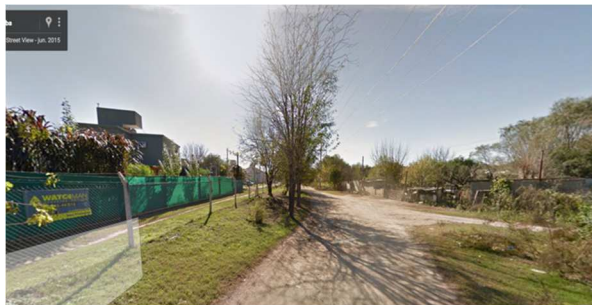
Figura 10. Vivienda colectiva en La Estanzuela.

b) En la escala urbano-barrial en barrios consolidados los emprendimientos residenciales renuevan el tejido por suplantación de tipología. Esta suplantación implica reemplazo de una unidad residencial por edificios o conjuntos de viviendas agrupadas o colectivas, lo que redundaría en un proceso de densificación. Este proceso de densificación acarrea sobrecarga de las infraestructuras, sobrecarga de la red vial y vuelve insuficiente los equipamientos complementarios a la residencia.