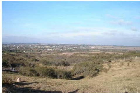
Figura 6. Urbanización La Cuesta.

Este caso posee otra arista que esta presentación quiere poner en consideración: el diseño de los bordes que colindan con las vías de acceso. En el caso de La Cuesta, el borde sobre la Av. Ejército argentino incorpora un muro de paneles pre moldeados que recorre toda la extensión del Barrio. (Fig. 7). La Estanzuela, por su parte, resuelve el borde con el barrio con un cerco alambrado perimetral que impide la libre circulación sobre calles públicas.