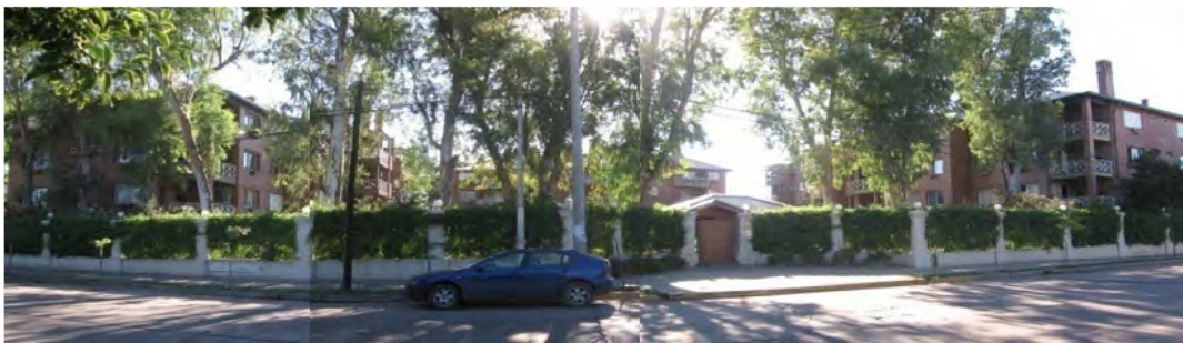
Figura 11. Conjunto Jardines del Sur. Barrio Jardín. Fuente: Liborio, 2010

c) En la escala tipológica-arquitectónica hemos registrado la ausencia de propuestas tipológicas que den frente a hacer ciudad y espacio público se introducen hacia el interior de dichos conjuntos y los fondos de lotes hacia la calle. Habiendo relevado el mal desempeño energético de los tipos arquitectónicos construidos y frente a una crisis energética global, la mitigación de estos problemas implica actuar y resolver cerramientos, envolventes a través de dispositivos pasivos de control climático. Con esta investigación proponemos crear criterios que permitan resolver envolventes adecuadas para su doble rol: como dispositivo soporte de la función simbólica y como dispositivo de acondicionamiento climático con un desempeño energético eficiente, tanto a escala del conjunto como de la unidad habitacional. El desarrollo de esta escala excede en su complejidad y longitud los alcances de esta presentación, sin embargo constituye un campo de investigación central para el equipo, toda vez que hoy como arquitectos estamos obligados a estudiar las formas de habitar de nuestra sociedad.