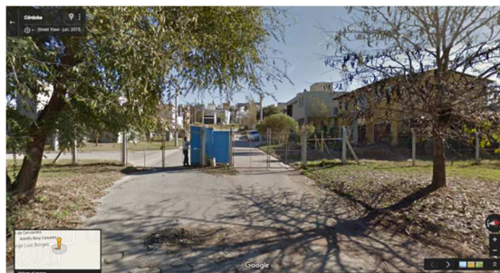
Figura 8 Borde Urbanización La Estanzuela.