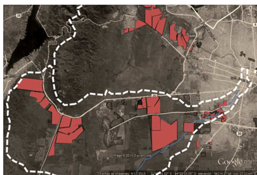
Figura 2. Urbanizaciones en la cuenca La Lagunilla- La Cañada.