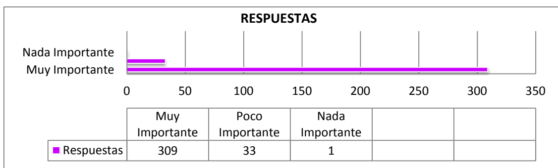
GRAFICO C. Importancia otorgada a las acciones asistenciales y curativas en salud. Enfermero/a Escolar, Escuela IPETyA N°53. Deán Funes, Segundo Semestre 2023.

Comentario: Se puede notar, que se considera como Muy Importante a las acciones asistenciales y curativas, destacándose la asistencia a posibles accidentes y a los talleres de primeros auxilios-soporte vital básico, ambos con un 100%. En cuanto a quienes las consideran como Poco Importantes, se observa que destaca como menos importante la administración de medicación con un porcentaje de 61,22%.