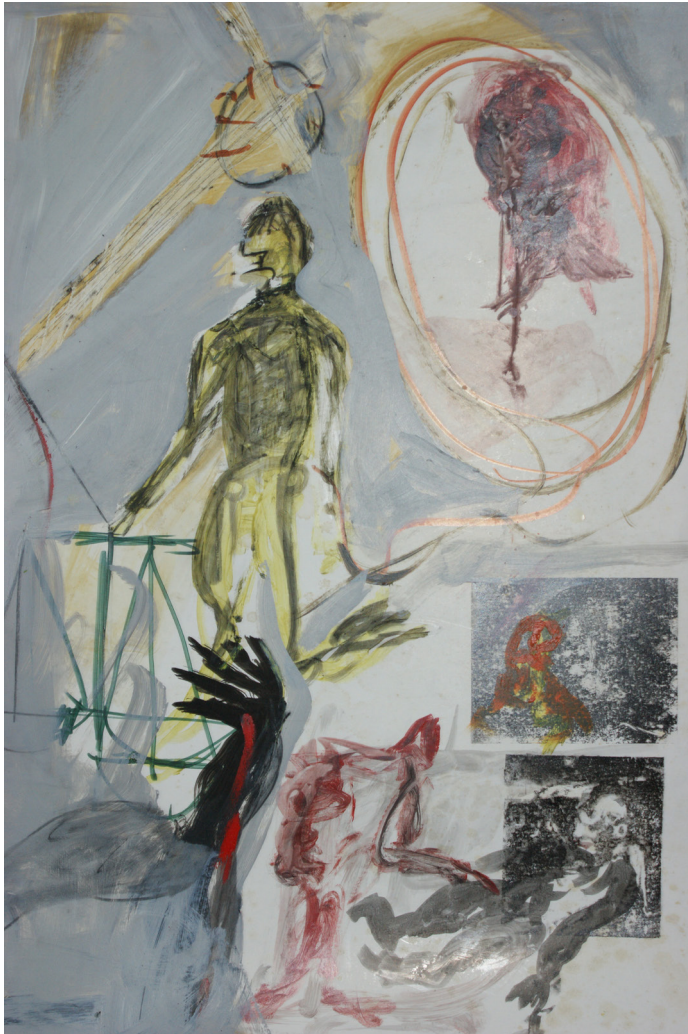
Imagen de tapa: Silvia Manca, "Sin título"