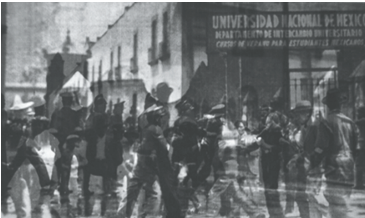
Oscar Padilla. TRANSPOSICION 3 . Imagen intervenida. 2017.

Ese escepticismo sobre la mera independencia política sin reafirmar principios en torno al poder económico —y culturalmente colonizar— mundial, lo ponía a la vanguardia de los combates políticos antiimperialistas del momento. ¿No es acaso esa desconfianza en la autonomía como mero aparato mayestático , como maquillaje organizacional que no enfrenta poderes fácticos reales, un principio importante para sostener una potencial idea de autonomía universitaria en la visión de Deodoro? La respuesta que arriesgamos es afirmativa, aunque sea como mera hipótesis debido a la ausencia de consideraciones sobre el asunto en materia universitaria de Roca.