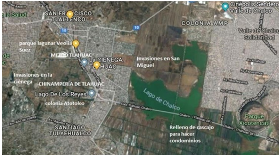
Figura 2. Chinamperías de Tlahuac. Mapa elaborado por Antelmo García

vender bajo la consigna zapatista: “la tierra no se vende, se ama y se defiende” Las otras dos solicitaban la venta de tierras o la permuta de las mismas.