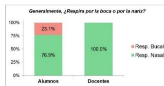
Fig 2. Respirador bucal o nasal