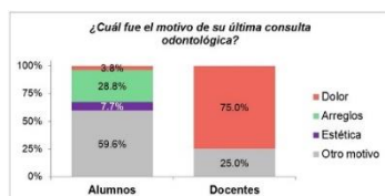
Fig 1. Motivo de la consulta

Los datos se obtuvieron de 64 encuestas, 52 alumnos (A) de 16,1 años de media, 12 docentes (D), de 53,9 años de media. Motivo de consulta: por dolor A=3.8% D=75%. ( p < 0,01 ). Respira por la boca o nariz: Arb=23,1% Drb=0%, Arn=76,9% Drn=100%. Momentos de comida por día: A=48% cuatro comidas, dos comidas 5,8%, D=100% cuatro comidas. Actividad física: A=14,4% no; D=25% no. Sonidos altos: A=48,1% D=0% ( p = 0,002 ).