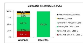
Fig 3. Momentos de comida en el día