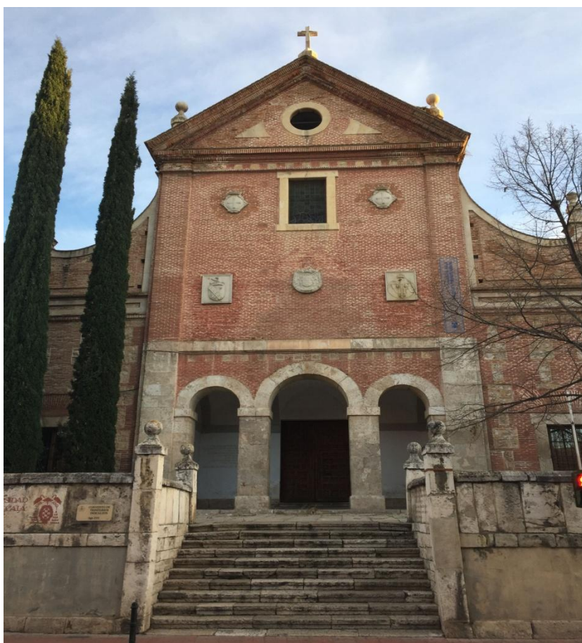
Colegio de Trinitarios, Universidad de Alcalá, sede del IELAT