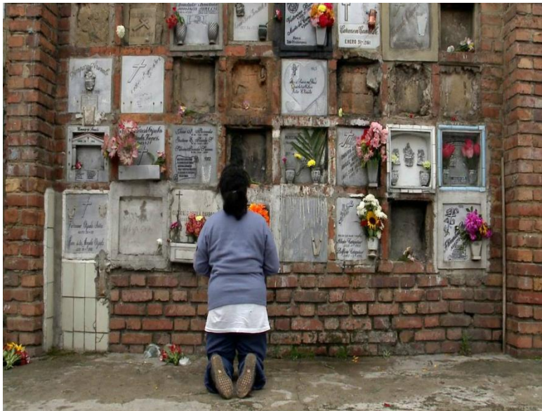
Ilustración 3. Fotograma Noche Herida (2015)

“(...) Ánima mía, ánima de paz y de guerra, ánima de mar y de tierra. Que todo lo que tengo ausente o perdido, se me entregue o se me aparezca (...)” (Rincón, 2015)