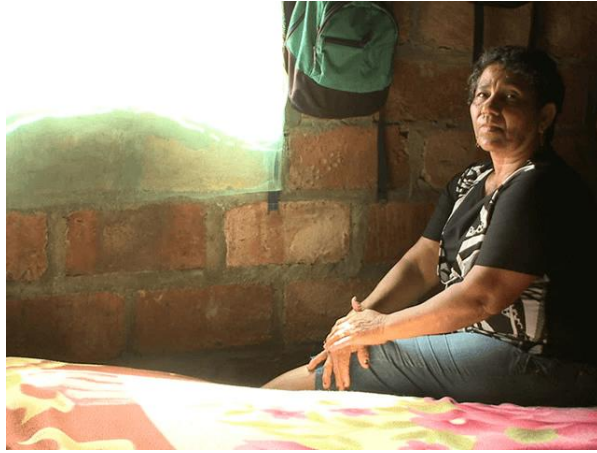
Ilustración 2. Fotograma Los abrazos del río (2010)

A partir del universo mitológico de la existencia del guardián de los ríos, se da inicio a este relato. A través de la figura del Mohán, que hace parte del folclore y mundo mágico colombiano.