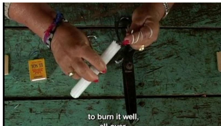
Ilustración 1. Fotograma En lo escondido (2007)