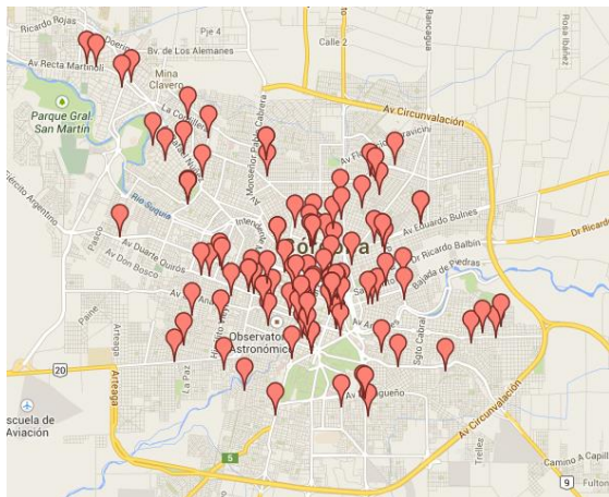
Fig. 2. Distribución de Servicios Técnicos en la Ciudad de Córdoba.

En el mapa de la Fig. 2 se registran 125 Servicios Técnicos distribuidos dentro de la circunvalación de la Ciudad de Córdoba, que tienen local de atención al público. El total de Servicios Técnicos encontrados asciende a 265. En la Cámara Argentina de Calefacción, Aire Acondicionado y Ventilación (CAAAV) existen matriculados en la ciudad de Córdoba 247 instaladores independientes, que también son potenciales generadores de RAEE.