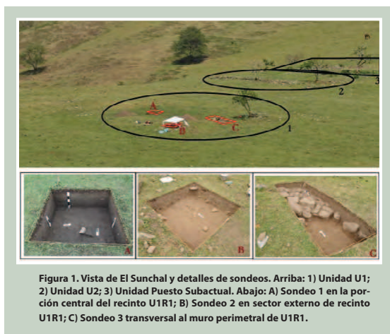
Figura 1. Vista de El Sunchal y detalles de sondeos. Arriba: 1) Unidad U1; 2) Unidad U2; 3) Unidad Puesto Subactual. Abajo: A) Sondeo 1 en la porción central del recinto U1R1; B) Sondeo 2 en sector externo de recinto U1R1; C) Sondeo 3 transversal al muro perimetral de U1R1.

Los materiales hallados permiten proponer que la estructura R01 de El Sunchal constituyó un espacio doméstico, hecha mediante el cavado de un pozo y utilizando para la construcción materiales vegetales percederos. La informalidad de esta construcción posibilita relativizar el grado de sedentarismo de sus ocupantes, aspecto interesante a considerar en una población del primer milenio, en principio asimilable a las englobadas dentro del "Formativo" (Olivera 2001).