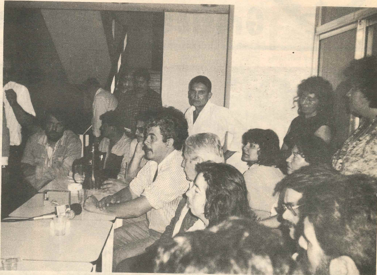
Aspecto de la conferencia de prensa en Jujuy.

Entendemos, y se lo dijimos fraternalmente, que estas actitudes no son dignas de trabajadores y menos de dirigentes de trabajadores.