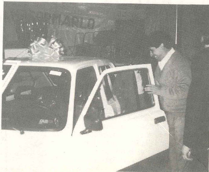
El ganador y toda la felicidad del mundo.

por eso nos oponemos a la Reforma Laboral, por eso nos oponemos a la desregulación de las Obras Sociales.