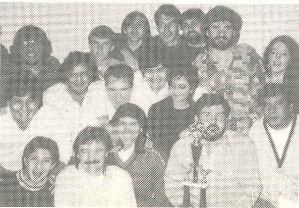
Este es "El Sótano de Duplicar"

Participaron compañeros de toda la Provincia, y se presentaron equipos de San Francisco, Río Cuarto y Villa Dolores. De Capital participaron 3 equipos, Marocco, Defensores del Centro, y El Sótano de Duplicar. Estos 3 equipos acceden a participar en virtud de haber salido Campeón, Sub-Campeón y Tercero respectivamente en el torneo realizado entre los Talleres de Capital. El espíritu deportivo y de confraternidad estuvo presente en todo momento y en un duro torneo, por el esfuerzo (se jugó en una jornada) los compañeros de El Sótano de Duplicar lograron la cumbre relegando en la final al poderoso equipo de Villa Dolores, que se ubicó en segundo lugar. El tercer puesto fue para Defensores del Centro. Cabe destacar que el 1º y el 2º se hicieron acreedores a una estadía de un fin de semana en la Hostería que posee nuestra organización en San Antonio.