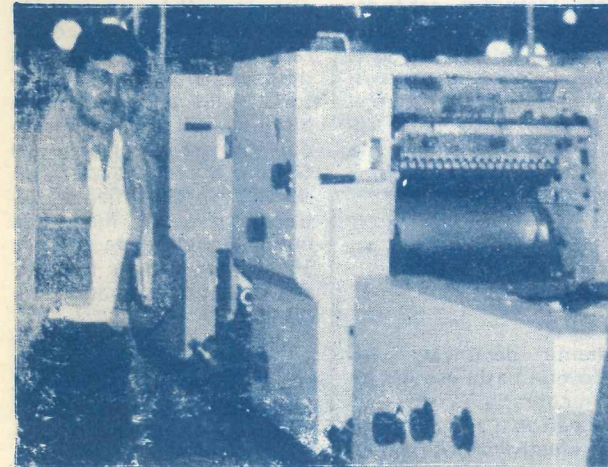
Dos aspectos de la feria internacional gráfica

Desde el día 6 al 15 de julio de 1984, se realizó en la Capital Federal la III Feria Internacional de la Industria Gráfica; el carácter de la misma es exponer al público el adelanto tecnológico en todas las ramas de la industria gráfica.