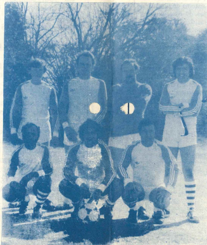
LA VOZ DEL INTERIOR "B"

Nis ingresó al campo en un estado físico increíble. ¡Qué estampa muchachos!,