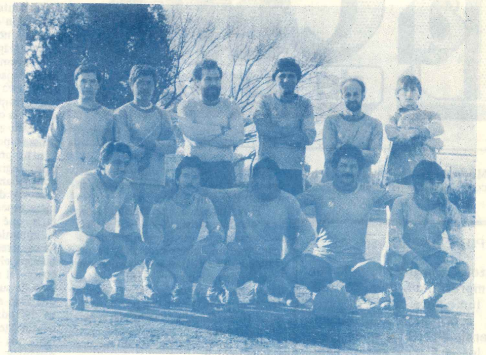
LA VOZ DEL INTERIOR "A"