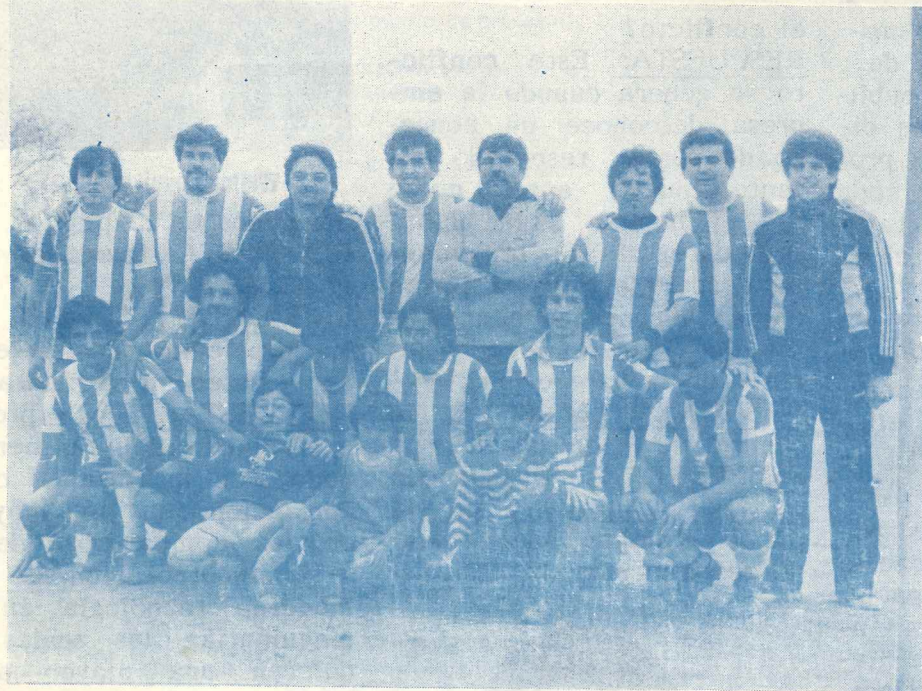
LA DOCTA CAMPEON

El Campeonato tuvo lugar en las instalaciones deportivas de IDEAL S.A., y se llevó a cabo los días 8 y 9 de julio del corriente. Competieron en este certamen los equipos de La Docta, Nis Boletín Oficial, La Voz del Interior "A" y La Voz del Interior "B" e IDEAL S.A..