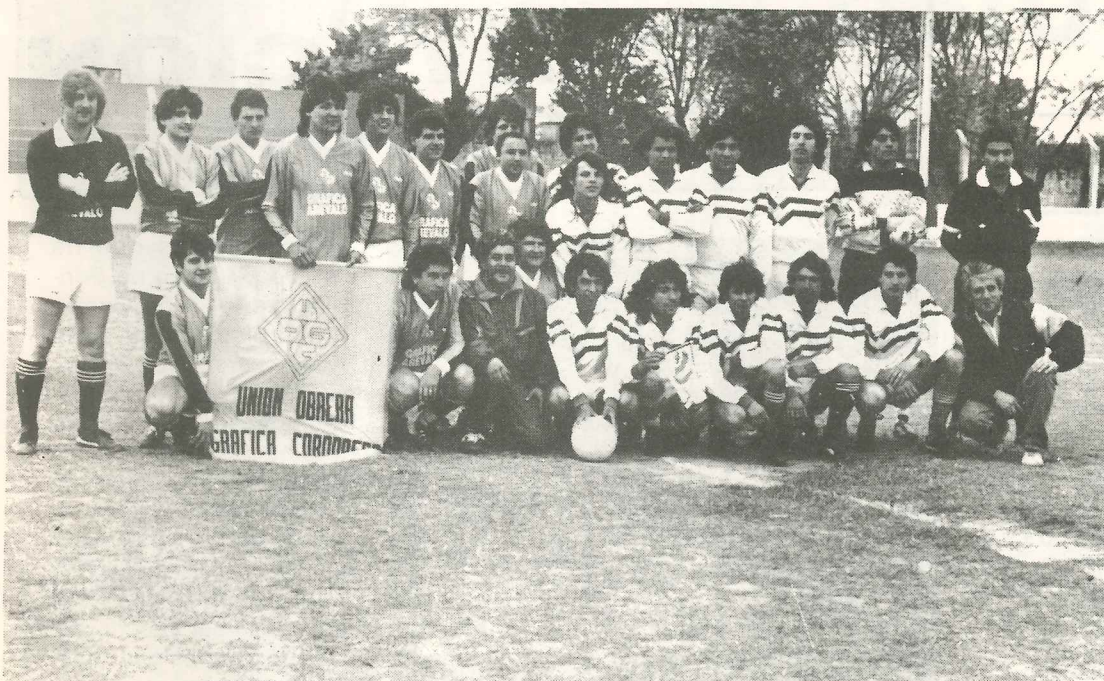
Dos de los cuatro equipos participantes