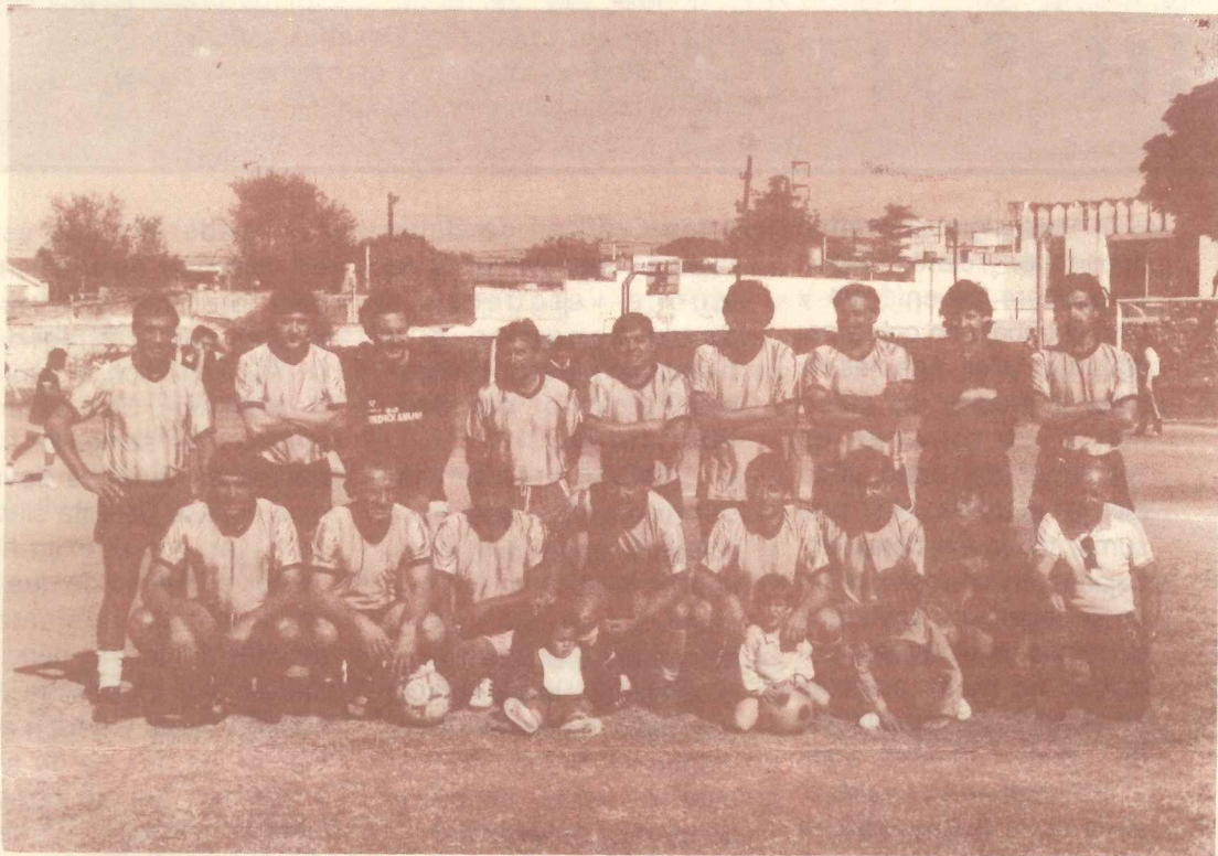
Equipo de La Voz del Interior

En el día 16 de Noviembre se jugó la última fecha del campeonato clausura de fútbol organizado por la UOGC en las canchas de la Ciudad Universitaria.