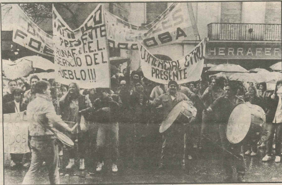
Los estatales de Córdoba contra las privatizaciones

• Un Estado destruido tras años de succión de sus recursos por la patria contratista, subsidios al capital privado, deuda externa, evasión impositiva y previsional, impidiendo la necesaria inversión de recursos para los presupuestos de salud, educación, saneamiento, transporte, energía, agravando así el dsmantelamiento de las empresas estatales al no contar con los recursos mínimos necesarios para su fun-