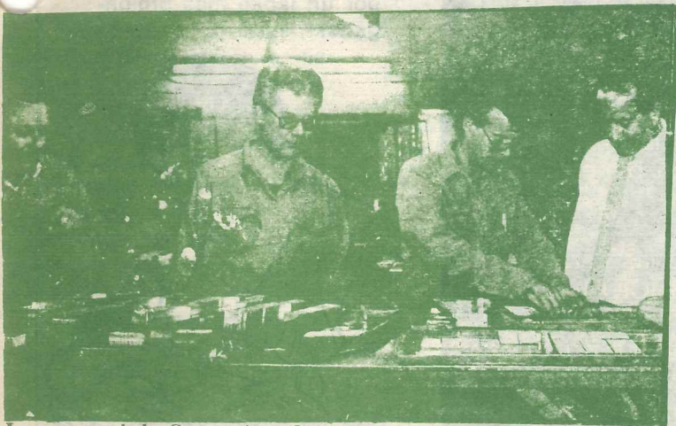
La patronal de Comercio y Justicia pretende maniobrar y desconocer derechos fundamentales de sus trabajadores

"Todo lo expuesto significa, claramente, una sola cosa: los directivos de Comercio y Justicia juegan con las necesidades elementales de su personal, tratando de reducirlos a una situación de desesperación. Ello es intolerable y los empleados de esta empresa recorreremos todo el camino necesario para que estas maniobras queden al descubierto frente a la opinión pública, y para preservar todos y cada uno de nuestros legítimos derechos como trabajadores".