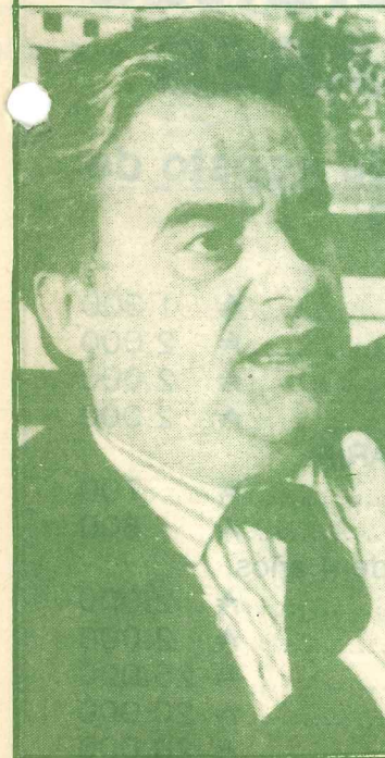
Jorge Triaca, ministro de Trabajo de la Nación. Paritarias con el techo de las pautas fijadas por el gobierno nacional, para que los salarios sigan siendo la variable de ajuste.

Y nosotros nos preguntamos: ¿Dónde están los famosos "colchones de precios" de los que habló tanto en nuestro país? Además, no debemos estar dispuestos a ser los trabajadores los que siempre tengamos que resignar nuestras aspiraciones mientras existen otros sectores que se benefician permanentemente.