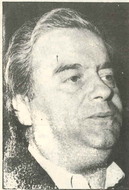
Jorge Triaca, ministro de Trabajo de la Nación.

Entendemos como válido un acuerdo de sectores, donde también intervenga el gobierno para intentar paliar esta crisis estructural que padecemos.