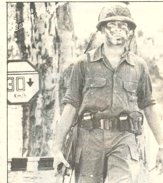
Los "carapintadas" correntinos, una triste imagen

A la pacificación nacional no se llega dejando en libertad o sin castigo a los asesinos y golpistas; a la pacificación nacional se llega con Justicia, con Justicia Social.