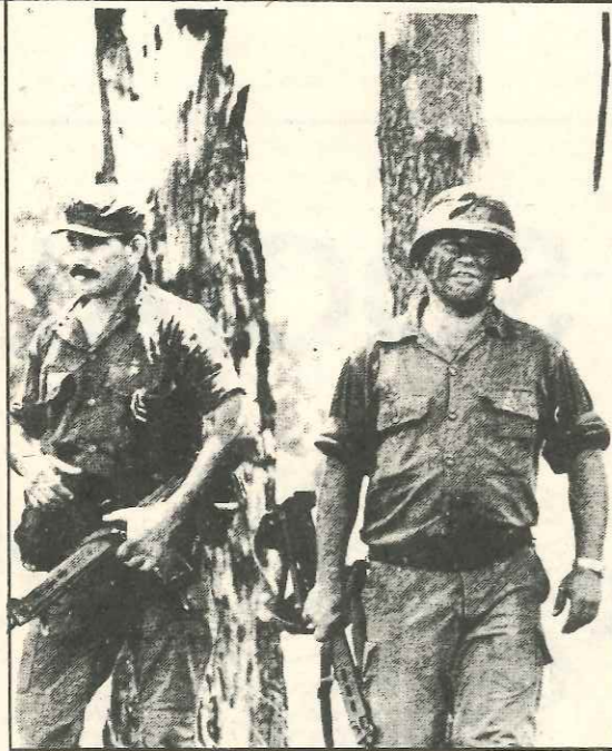
"Rangers" del subdesarrollo.

Todas estas concesiones han llevado a que los militares sigan intentando que se deje en libertad y sin juzgar a la totalidad de los militares responsables del genocidio.