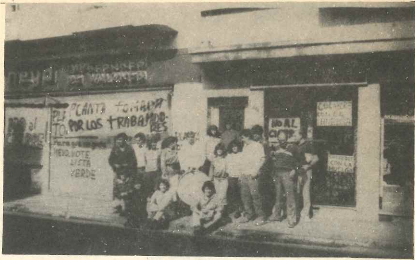
En defensa de las fuentes de trabajo, luchar.

El personal de la Impresora de Valores HEYD, ante el planteamiento, por parte de la patronal, de "cierre definitivo" por problemas económicos y financieros, el día 7 de octubre decidió ocupar la planta "en defensa de la fuente de trabajo" y cobro de los salarios adeudados.