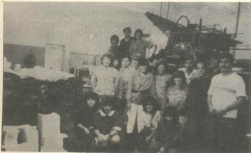
Ocupación de planta: una forma de defender nuestros derechos.

El gobierno tiene que intervenir garantizando la continuidad de las fuentes de trabajo con probabilidades de cierre; por nuestra parte seguiremos implementando las medidas necesarias en el camino de la lucha hasta lograr que se revierta esta situación.