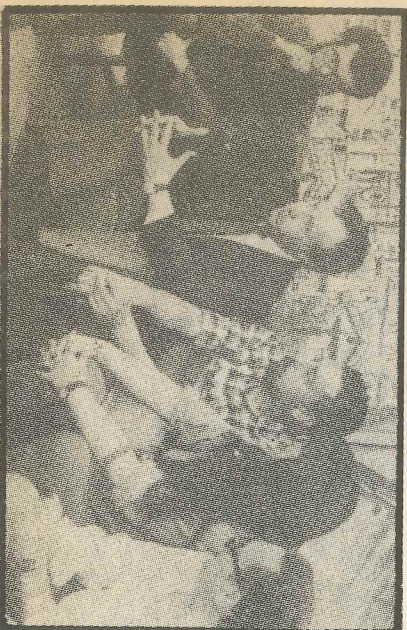
Dirigentes de los dos gremios en conflicto Información en Pág. 3