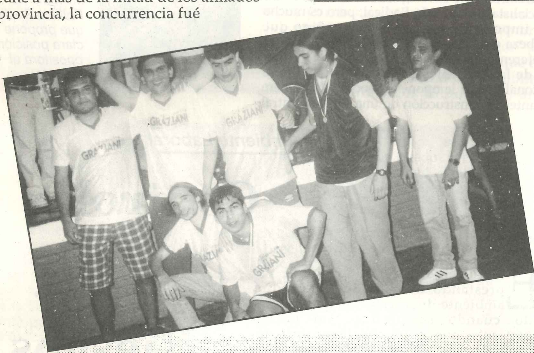
Subcampeón. GRAFICA GRAZZIANI ocupó el segundo puesto del certamen. Tercero se ubicó el equipo de ZAMPETTI.