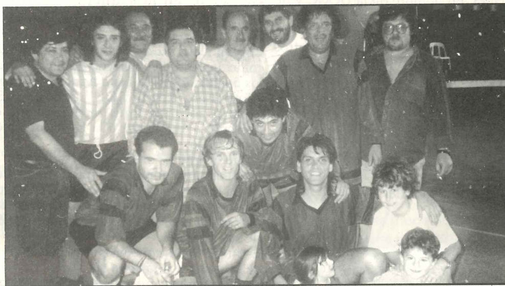
El campeón. El equipo de LA IMPRENTA se adjudicó el campeonato relámpago jugado durante el día del trabajador gráfico.