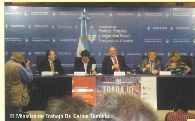
El Ministro de Trabajo Dr. Carlos Tomada