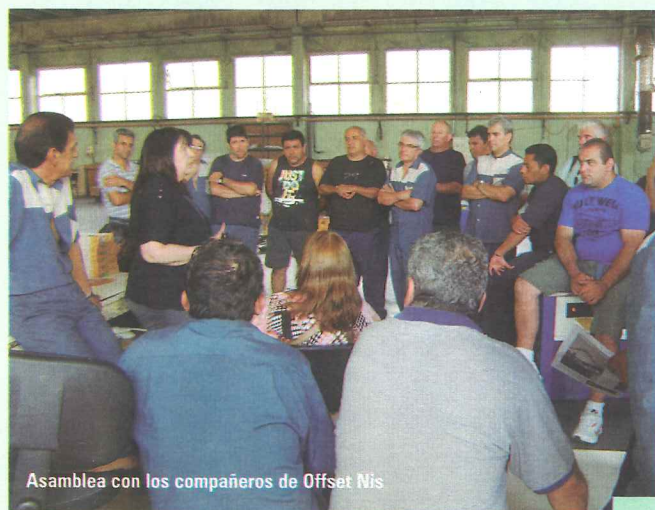
Asamblea con los compañeros de Offset Nis

Se citó a audiencia a los efectos que presente la documentación laboral por los últimos seis meses. La empresa presentó la documentación con los recibos de haberes por doce trabajadores. La UOGC tomó conocimiento de lo exhibido, observando la errónea liquidación producida por el descuento doble del aporte de los artículos 56 y 57 del CCT, y el faltante de horas en algunos trabajadores. La empresa solicitó plazo para corregir las observaciones detectadas, fijándose una nueva fecha de audiencia, en la cual presentó los recibos de haberes con las correcciones observadas. La UOGC tomó conocimiento de las correcciones presentadas, solicitando el archivo de las actuaciones.