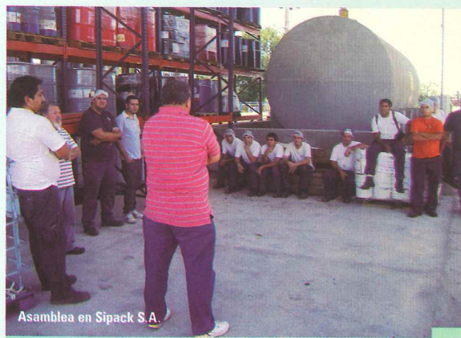
Asamblea en Sipack S.A.

SIPACK S.A.: Se citó a la empresa a los efectos que aclare la suspensión aplicada a un trabajador esgrimiendo motivos deducidos de la utilización de cámaras de seguridad. La UOGC la rechazó por improcedente y falaz ante una supuesta acción dudosa del trabajador, e intimó a que inmediatamente dejara sin efecto la sanción aplicada. Al mismo tiempo, se dejó constancia de que las cámaras de seguridad no pueden ser utilizadas para presionar, perseguir o aplicar sanciones disciplinarias a los trabajadores ya sea de manera directa o indirecta, y que no deben estar dispuestas a controlar el trabajo. La empresa solicitó un cuarto intermedio fijándose una nueva audiencia, donde la empresa dejó sin efecto la sanción disciplinaria, que se notificó en ese mismo acto al trabajador. La representación sindical tomó conocimiento de lo resuelto por la patronal y acordaron en conjunto solicitar una inspección de higiene y seguridad a los fines de verificar la ubicación de las cámaras de seguridad.