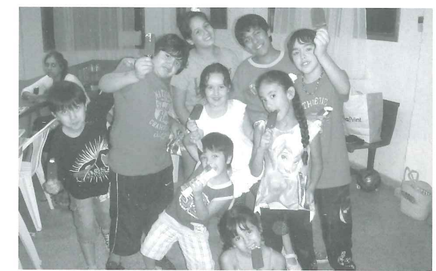
Compañeritos de Cosquín