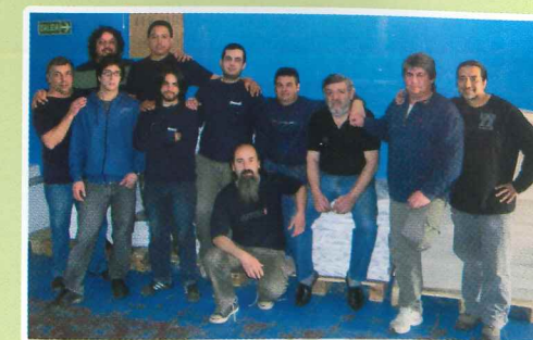
Elecciones de representantes de los talleres, renueva el Cuerpo General de Delegados de la UOGC