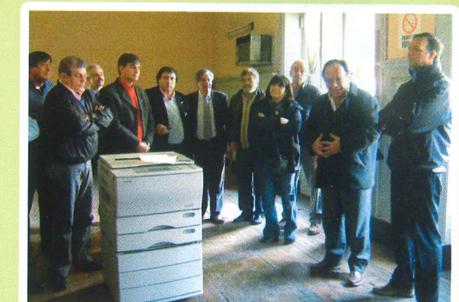
El movimiento obrero de Córdoba recupera la sede histórica de la CGT