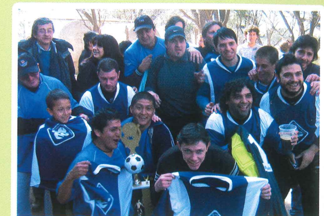
Apertura 2010: Soluciones Gráficas Campeón