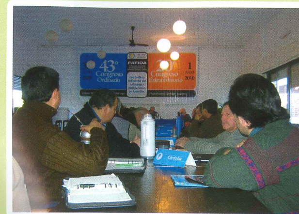
Fatida: 43º Congreso Ordinario y 20º Congreso Extraordinario