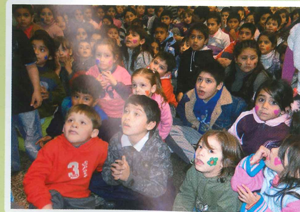
Festejos Día del Niño en toda la provincia