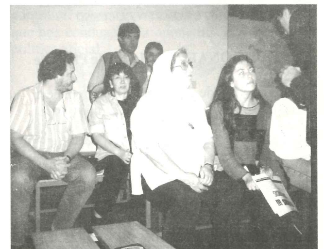
LA DELEGACION GRAFICA EN LA AUDIENCIA