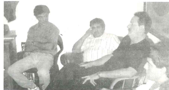
Delegados gráficos con dirigentes cubanos

* La Capacitación Profesional fué la base de acuerdo con el dirigente de Galicia, quien se dispuso a trasladarnos a la brevedad una propuesta.