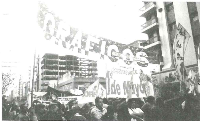
El Gremio Gráfico en la marcha del 24 de marzo

El mismo 24 se realizó una multitudinaria marcha de la que participaron más de 4.000 manifestantes, dando una contundente muestra de que el pueblo además de no olvidar, exige castigo a los asesinos.