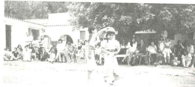
San Antonio de Arredondo 7 y 8 de Marzo

Entre trabajadores gráficos y pobladores de la zona asistieron más de 250 personas, para las que actuaron 10 conjuntos musicales y grupos de danza, de un altísimo nivel profesional. Estos resultados nos animan a seguir realizando actividades culturales en la zona.