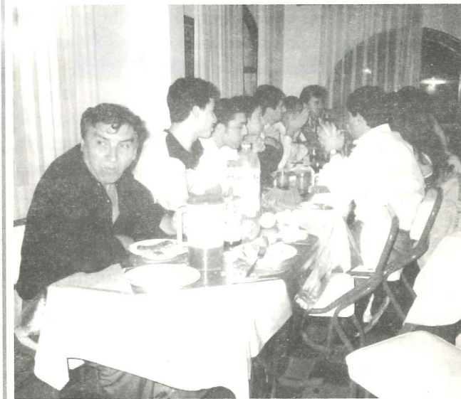
BASTANTE DEBATE Y CONFRATERNIDAD EN LA CENA DE LOS COMPAÑEROS DE GRAZIANI GRAFICA

Los trabajadores de esta empresa se autoconvocaron en La Casa de los Trabajadores Gráficos "Los Pinos" el día 18 de Marzo a los fines de compartir un asado (costillar completo). Esta fué la excusa que utilizaron para afianzar los lazos de confraternidad, oportunidad en la que no estuvo ausente la valoración de la situación en el taller y las propuestas de resolución a temas pendientes. Como era de esperar tampoco faltó el truco y el baile, donde varios valores expusieron sus virtuosos movimientos.