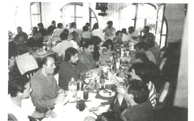
PROMEDIANDO EL DEBATE, SE COMPARTIO UN EXQUISITO ASADO

También reflexionó sobre la urgente necesidad de unidad en el movimiento obrero y doblar el trabajo en todos los ámbitos para contribuir a crear conciencia sobre los caminos que nos conduzcan a oponernos con éxito a la política oficial.