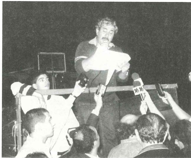
Lectura del documento de la Multisectorial

Orgullosos estamos, porque nuestro gremio por su consecuencia y conducta fué propuesto a los fines de leer el documento acordado por las más de las 30 organizaciones que integraron la Multisectorial.