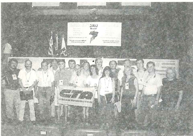
Delegación de la CTA que participó de la Cumbre