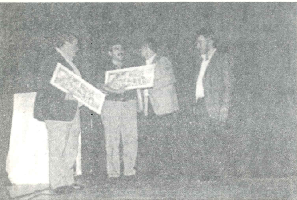
Entrega de reconocimiento a los gremios Gráfico y de Prensa

Entre todos, recuperamos 10.000 puestos de trabajo que se estaban hundiendo o que ya habían desaparecido de la superficie.