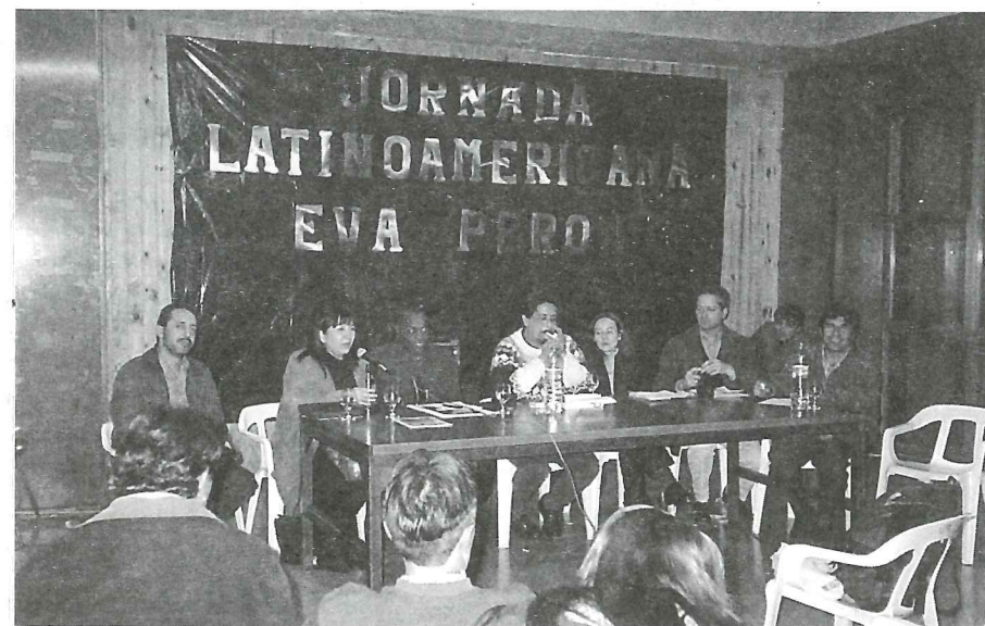
▲ Jornada Latinoamericana

Con gran presencia de público, la evocación de Evita se caracterizó por la comparación entre su personalidad inculdicable y apasionada en la defensa de la justicia social y la dirigencia política entregada a los intereses del capital y del bloque dominante.