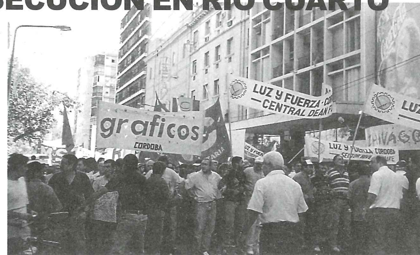
▲ Compañeros gráficos y militantes de otras organizaciones populares en Río Cuarto

Los compañeros de Río Cuarto expresaron se expresaron en el mismo sentido el día 9, cuando se realizaba el desfile con la presencia del gobernador De la Sota. Ahí volvieron a mostrar lo que realmente son, cuando la policía se comportó como un ejército de ocupación, persiguiendo y deteniendo a quienes confrontan con las ideas oficiales. Hubo detenidos que recuperaron su libertad gracias a la movilización realizada por los compañeros, entre quienes se encontraban gráficos, CTA, Prensa, Vecinos Autoconvocados, organizaciones barriales y sociales y de derechos humanos.