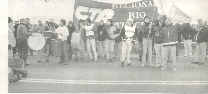
Río Tercero en corte de ruta >