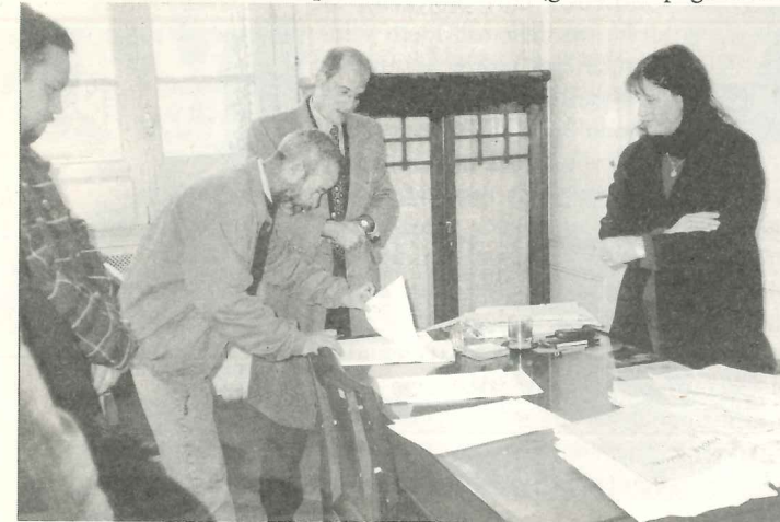
▲ La Jueza adjudicando el Diario a los compañeros

Los trabajadores de Comercio y Justicia son y seguirán siendo para los gremios, compañeros igual que otros, con la única diferencia que se vieron asumieron el desafío de autogestionar su fuente de trabajo ante el accionar estafador de los empresarios y como consecuencia directa de la firmeza de sus decisiones.