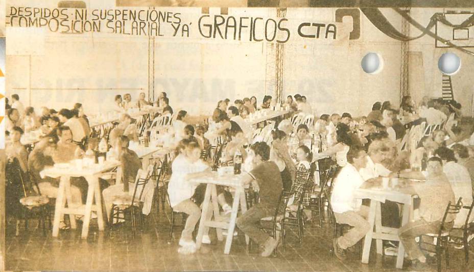
◀ Córdoba ▶

canto estiraron las horas, en las que contamos con la presencia de compañeros de gremios y organizaciones hermanas.