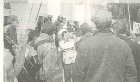
Río Cuarto en jornada combativa ▲