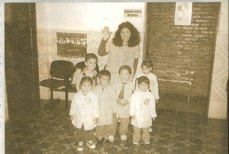
▶ "Estrellita de Belén": Nuestros hermosos visitantes ▶