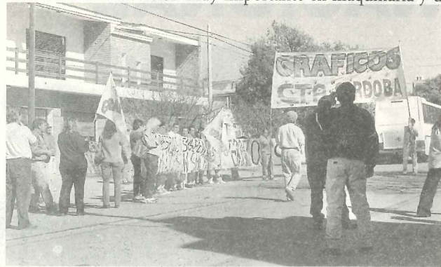
▲ Frente a la cámara Patronal

Pero tenemos que empezar y lo hicimos. El 7 de mayo, estuvimos frente a la sede de la Cámara Gráfica de Córdoba, manifestando por nuestros salarios y por el cese de los despidos y las suspensiones. En ese acto, nos felicitamos a nosotros mismos por el grado de conciencia alcanzado por los compañeros gráficos que sostuvieron la protesta. Fuimos acompañados por la CTA y por el Centro de Desocupados de barrio Kennedy, a quienes les agradecemos su solidaria presencia.