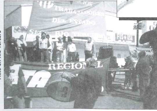
Acto en Río Tercero