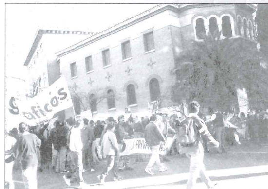
La U.O.G.C. en la Marcha del 28 de Agosto

Lamentamos todas las muertes producidas, pero eso no nos hace perder de vista las muertes que se producen todos los días a consecuencia de los planes de hambre y miseria que se dictan precisamente desde esos centros económicos y mucho menos olvidamos los cientos de miles de muertes en Latinoamérica y el mundo producidas por decisiones políticas adoptadas por el gobierno de los Estados Unidos para resguardar su hegemonía.