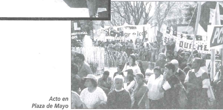
Acto en Plaza de Mayo