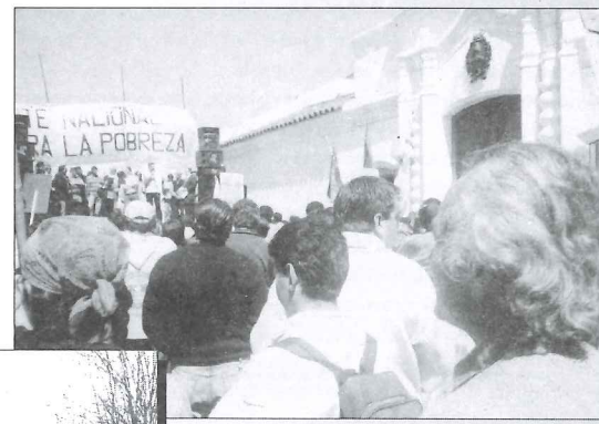
Acto frente la "Casa de Tucumán"