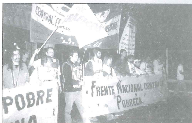
Marcha en La Rioja