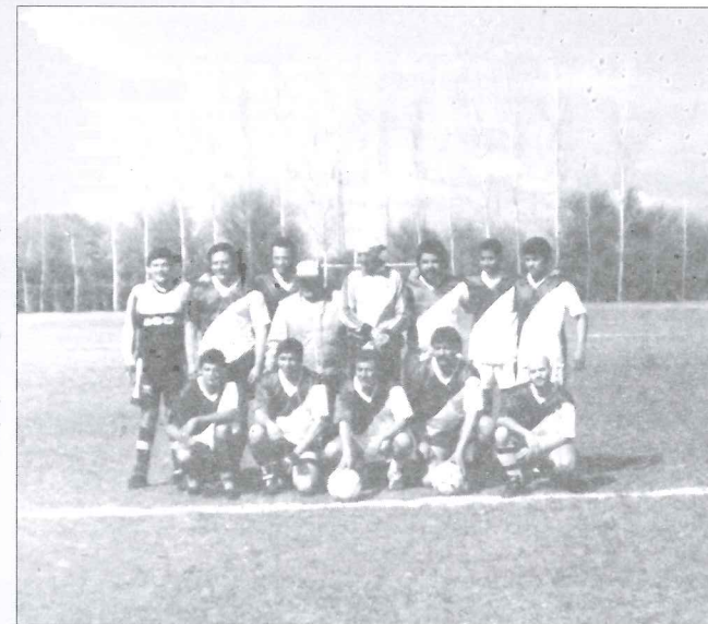
Equipo de Córdoba Capital

También hubo truco en un clima de fiesta, que mejor reflejan las fotos que ilustran esta nota.