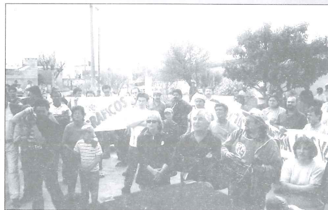
Acto en Bell Ville