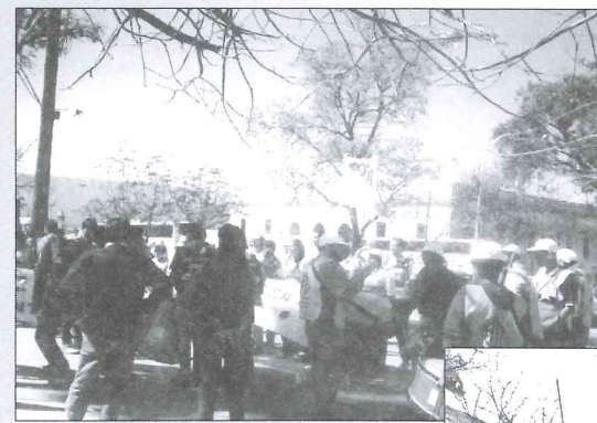
Marcha en Catamarca