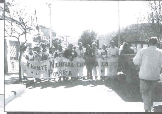
Marcha en Chical