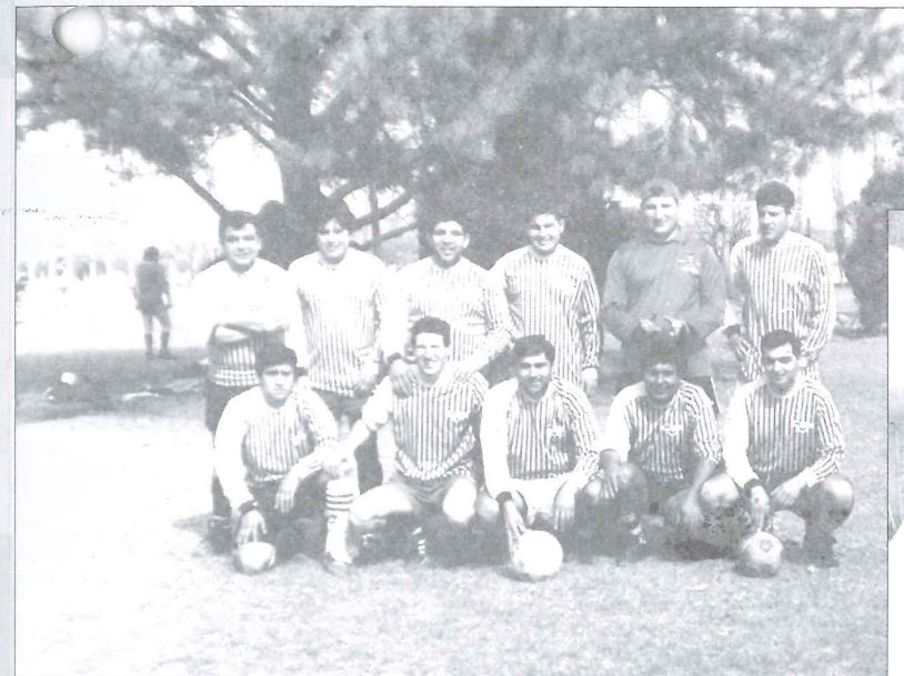
Equipo de Villa Dolores