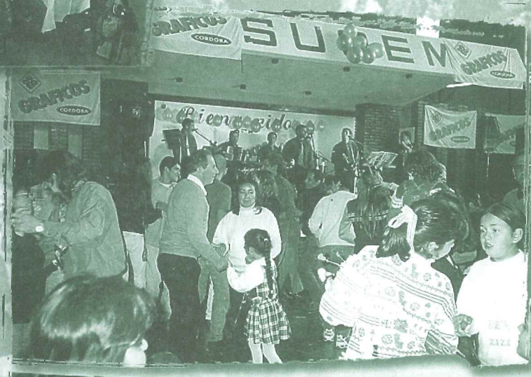
▲ Luego del almuerzo se armó el baile

RIFA: 1º) 79; 2º) 360; 3º) 484; 4º) 429; 5º) 170; 6º) 747; 7º) 450; 8º) 661; 9º) 415; 10º) 961.