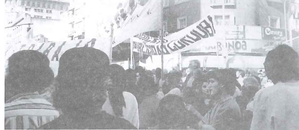
▲ La U.O.G.C. en la movilización del 29 de Mayo

• En solidaridad con los trabajadores de AEROLINEAS ARGENTINAS, que hoy están pidiendo que el estado se haga cargo de la empresa ya que la privatización fue un de-