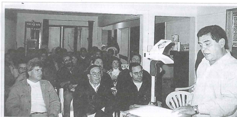
▲ Curso de Higiene y Seguridad, en Artigas

La importancia de la iniciativa y el interés que despierta hacen que la UOGC deba seguir participando y promoviendo la asistencia de los compañeros a todas las actividades que se preven en el futuro.