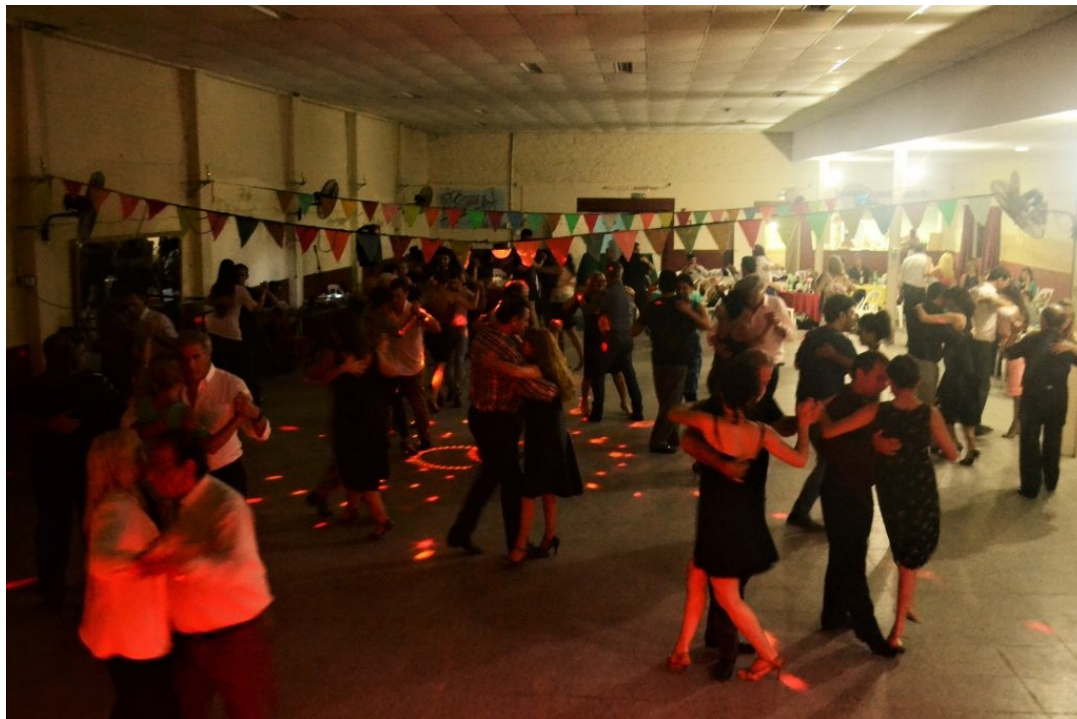
Fig. N°2: Milonga popular en el Club.