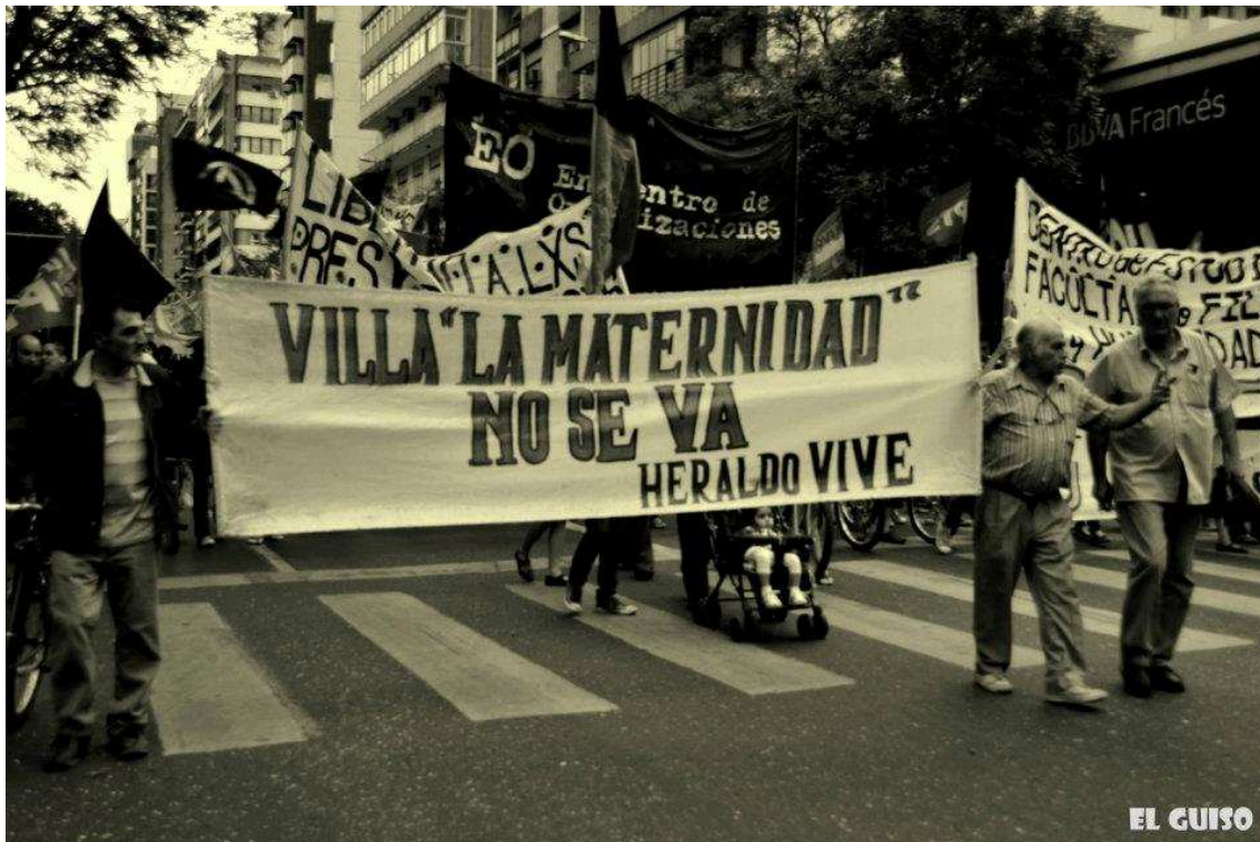
Gráfico 8: Participación de vecinxs de Villa La Maternidad en la marcha por el Día Internacional de los Derechos Humanos realizada por las calles de la ciudad de Córdoba el 7 de diciembre de 2011.