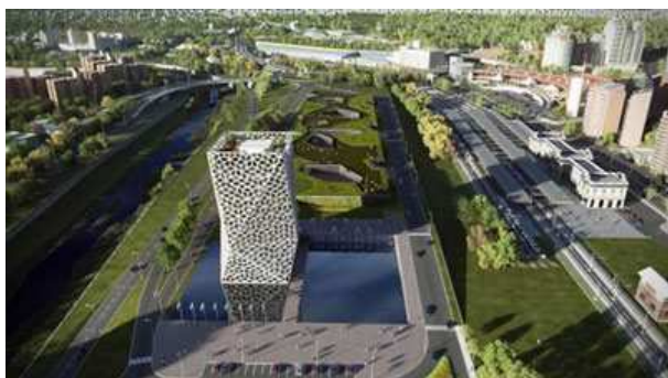
Gráfico 1: Nuevo Centro Cívico Provincial. Costanera y Estación Mitre (Área central, pericentral, próximo a Villa La Maternidad).

Los procesos de gentrificación se dan en paralelo con los procesos de re-novación urbana (por emprendimientos públicos o privados) asociados fundamentalmente a la re-valorización de la propiedad privada fomentada por el propio Estado provincial o municipal. Un ejemplo de esto son las llamadas “áreas especiales” que dejan liberado a un acuerdo público- privado al margen de las normativas vigentes. Tal es el caso de las Torres Capitalinas (Cañada y Costanera, área central) y el ex batallón 141 (próximo a Ciudad Universitaria, área pericentral). Emprendimientos privados de viviendas y oficinas de gran escala que se pactan en base a beneficiosas "licencias" al código de edificación vigente a cambio de la construcción de infraestructuras para la ciudad por parte del sector privado (espacio público, cloacas, agua, etc.), cuestión que rara vez se cumple.