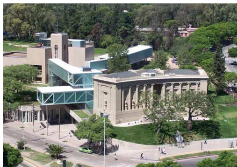
Gráfico 2: Museo Provincial E. Caraffa. (Área pericentral)