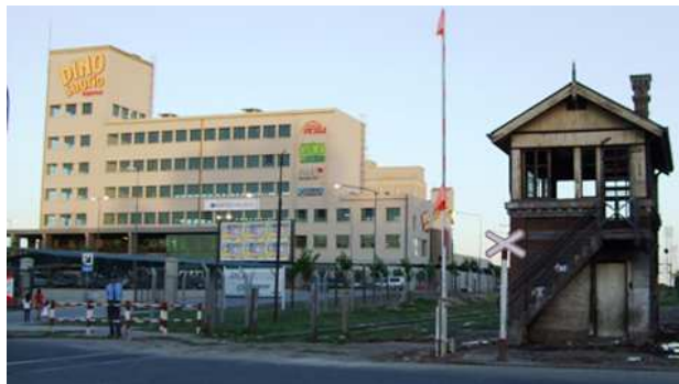
Gráfico 4: Dinosaurio Mall. San Vicente (Próximo a Villa La Maternidad)