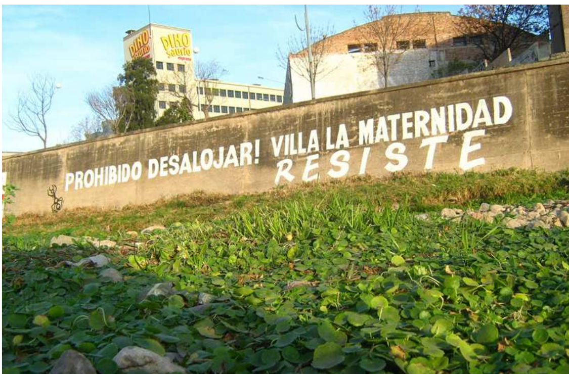
Gráfico 7: Vista hacia el Dinosaurio Mall desde Villa La Maternidad.

a la existencia de asesoramiento jurídico. Las familias asentadas por más de 20 años en Villa la Maternidad, además de estar amparados por toda la normativa nacional e internacional en materia de derecho a la vivienda, poseen un derecho de propiedad adquirido. La conformación de una “Comisión Contra el Desalojo”, se encuentra dentro de las estrategias de auto-organización. La Comisión comenzó reuniéndose todos los jueves a partir de las 18 horas en la Plaza Agustín Garzón con modalidad de “Asamblea”. A partir de allí comenzaron a desarrollar múltiples actividades (festivales, entrevistas con funcionarios públicos y medios de comunicación) que lograron fundamentalmente, instalar su problemática habitacional en los medios y la opinión pública, logrando así la solidaridad y el apoyo de múltiples organizaciones sociales y políticas. Desde un inicio, este grupo que resistió al desalojo, reclamaba la construcción de viviendas dignas en oposición a la erradicación y alertaban a los vecinos sobre las condiciones de contaminación a las que iban a ser trasladados.