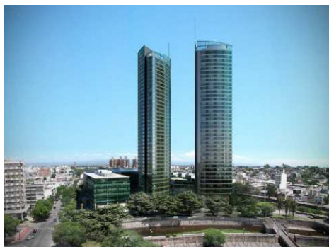
Gráfico 3: Torres Capitalinas, hotel y oficinas. (Área pericentral, próximo a Costanera y Cañada (Área central).