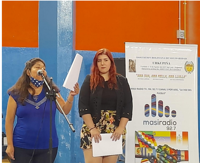
Figuras J: Entrega de Recuerdos a Cada Uno de los Participantes del Octavo Encuentro Nacional de Líderes Migrantes en Argentina.