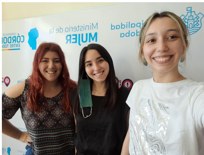
Figura B: Equipo de Córdoba de camino hacia la Localidad de Cinco Saltos - Río Negro para la Asistencia a los Encuentros Nacionales.

Figura A: Asistencia al Ministerio de la Mujer de la Ciudad de Córdoba, como parte de la Actividad Organizativa para los Encuentros Nacionales. Trabajando en Conjunto con una Compañera de la Licenciatura en Ciencia Política