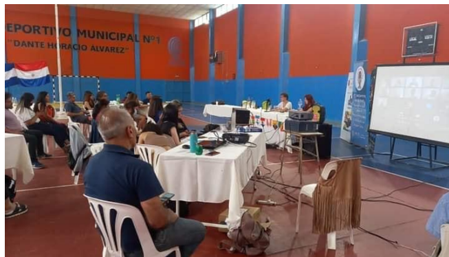
Figuras H: Momentos de esparcimiento