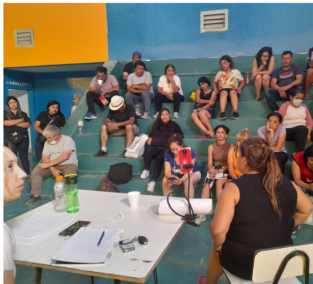
Figura F: Continuidad de la Modalidad de Trabajo Híbrida y Recopilado de Información para nuestro Cuaderno de Campo.

Nota: Nuestro aporte siendo moderadoras entre los asistentes virtuales y presenciales.