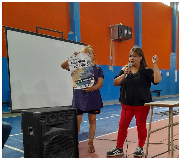
Figura K: Consigna “Aquí Vivo, Aquí Voto”.

Nota: Recibimos como alumnas de la Facultad de Ciencias Sociales de la Universidad de Córdoba uno de los mismos.