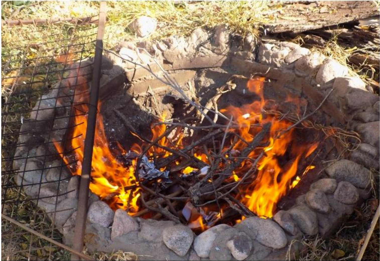
Encendido de horno.