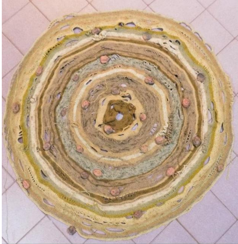
Manta circular en proceso de creación.