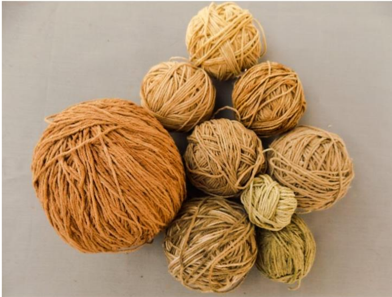
Ovillos de hilo de algodón teñido con variedad de tintes verdes y marrones.