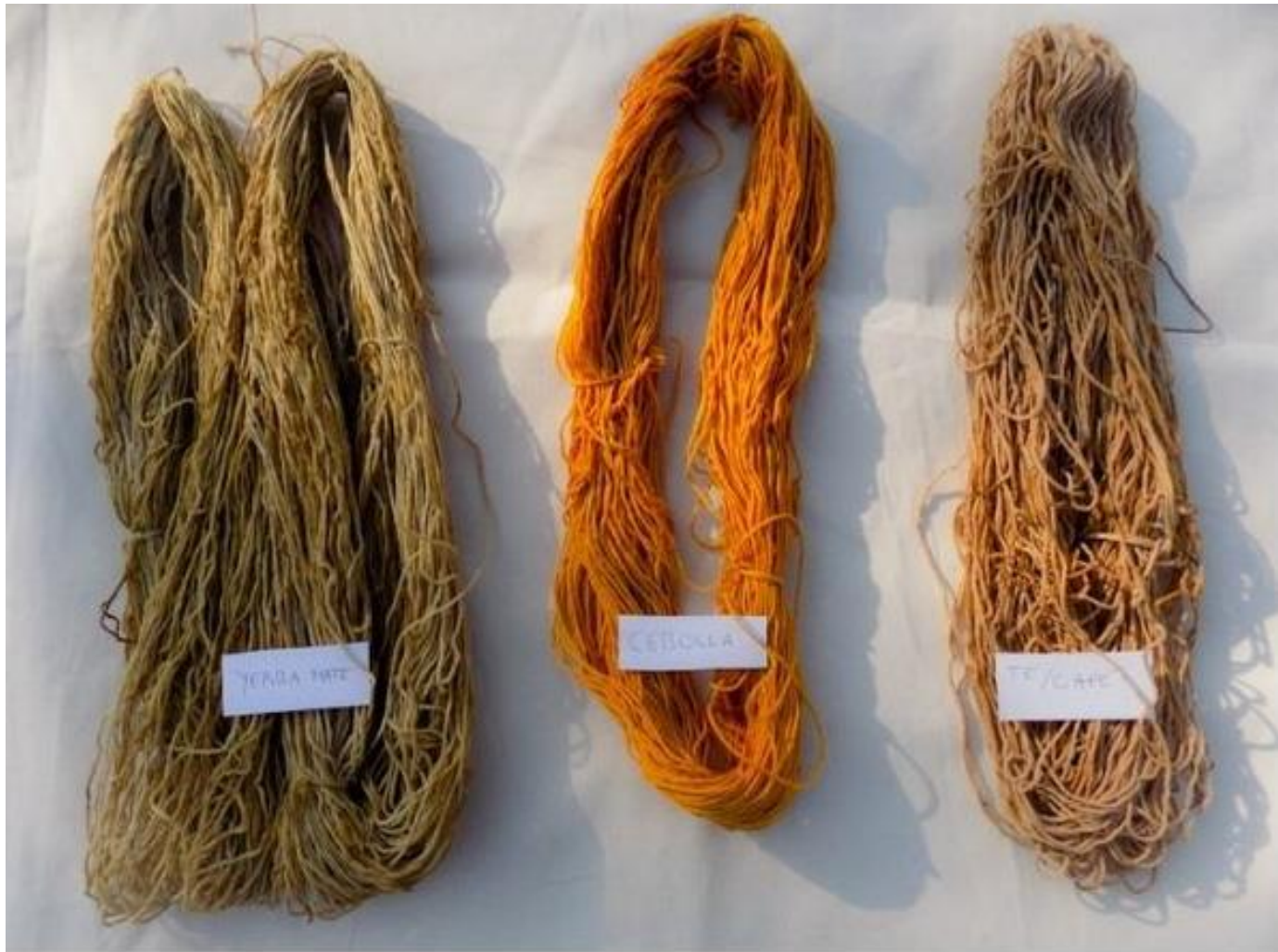
Hilos teñidos con yerba mate, cebolla, té y café