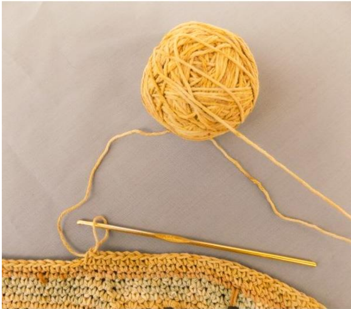
Proceso de tejido de la manta circular