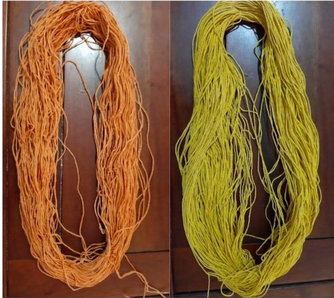
Hilos teñidos con pimentón y cúrcuma