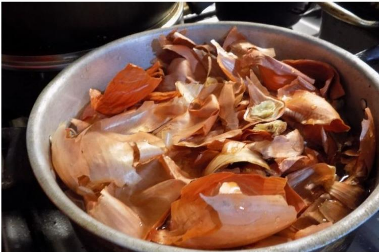
Maceración de la piel de la cebolla