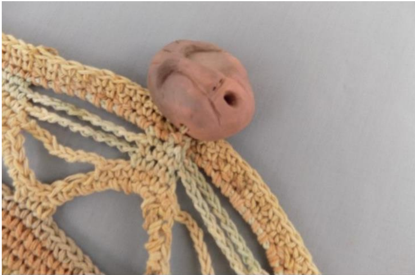
Detalle de los calados en el tejido y sujeción del rostro de barro cocido.