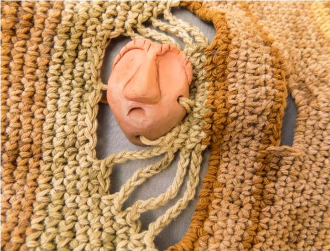
Detalle de rostro en manta circular