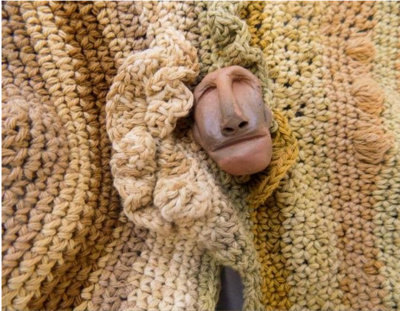
Detalle de rostro en manta circular