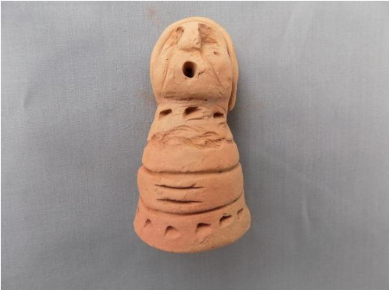
Una de las estatuillas que se ubica dentro de las vasijas.