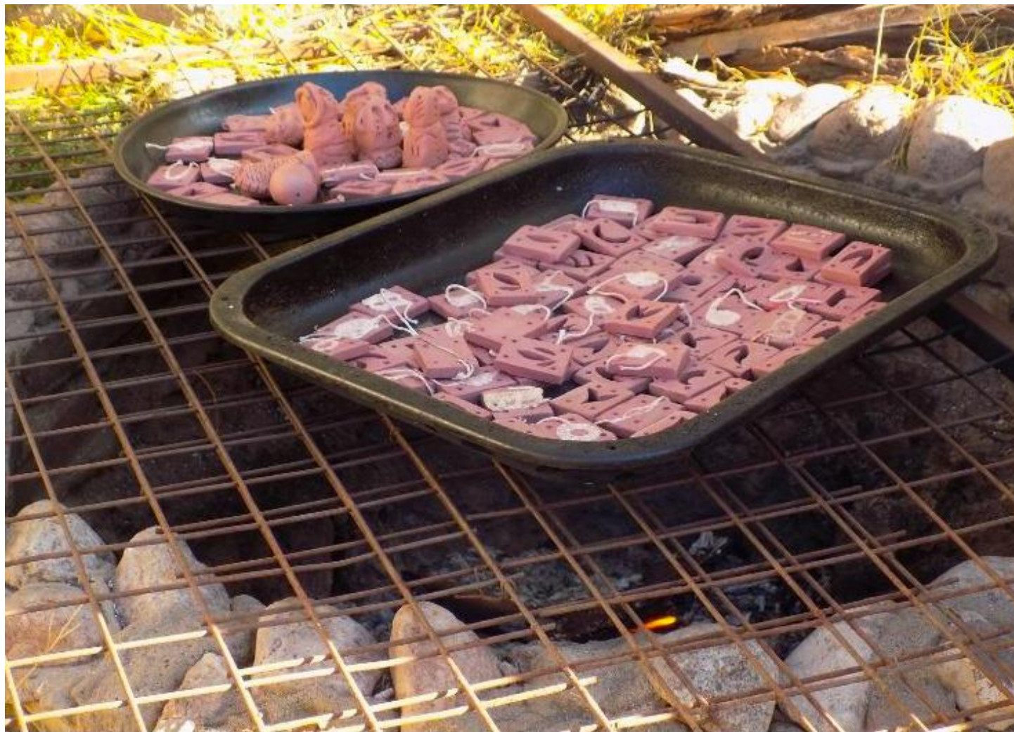
Templado de piezas de barro antes de su cocción