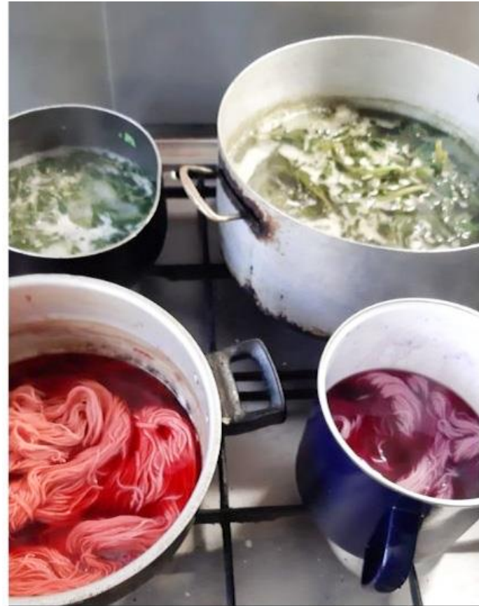
Preparación de tinte de acelga. Teñido con remolacha y vino tinto