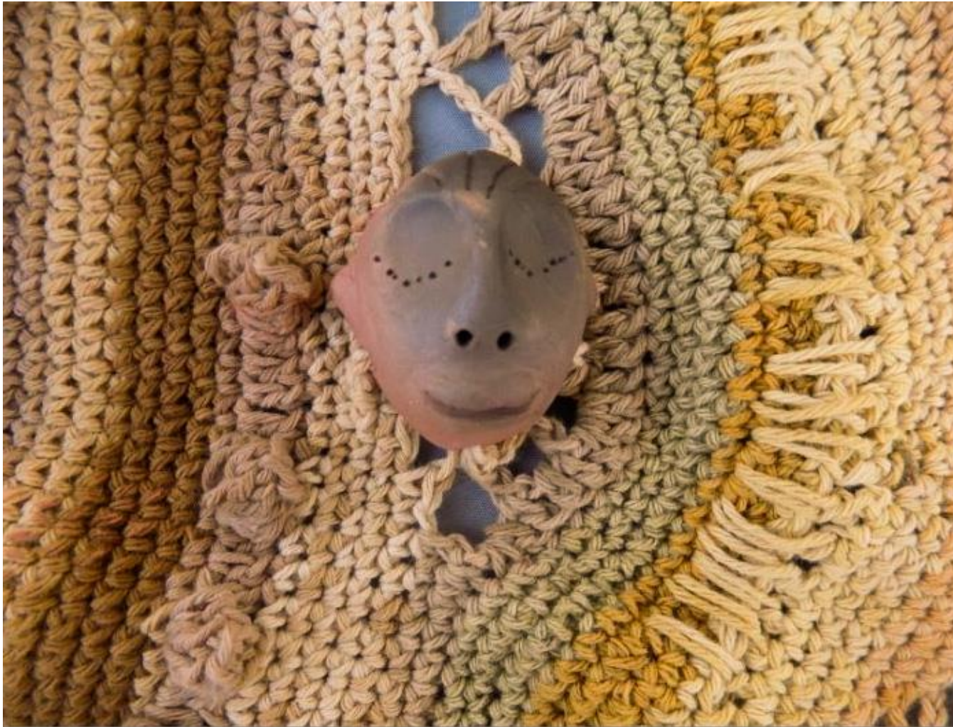
Detalle de rostro en manta circular