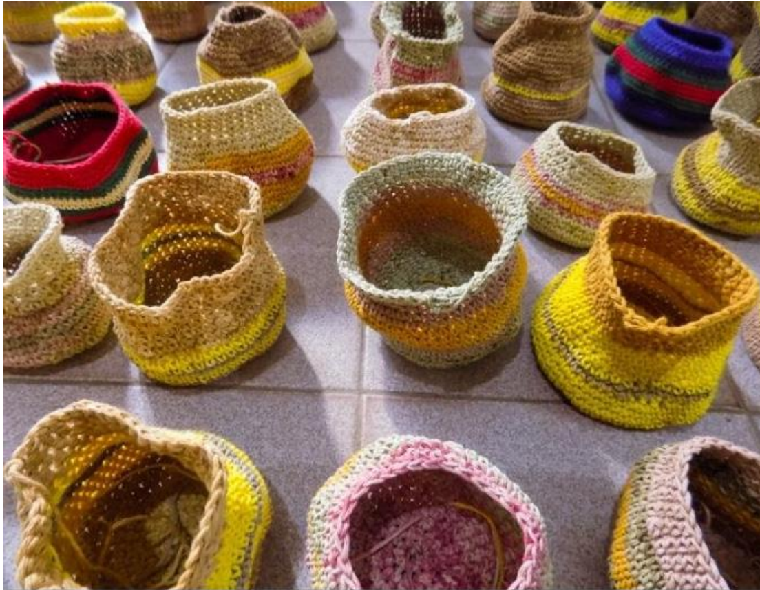
Detalle de proceso: manta con vasijas tejidas