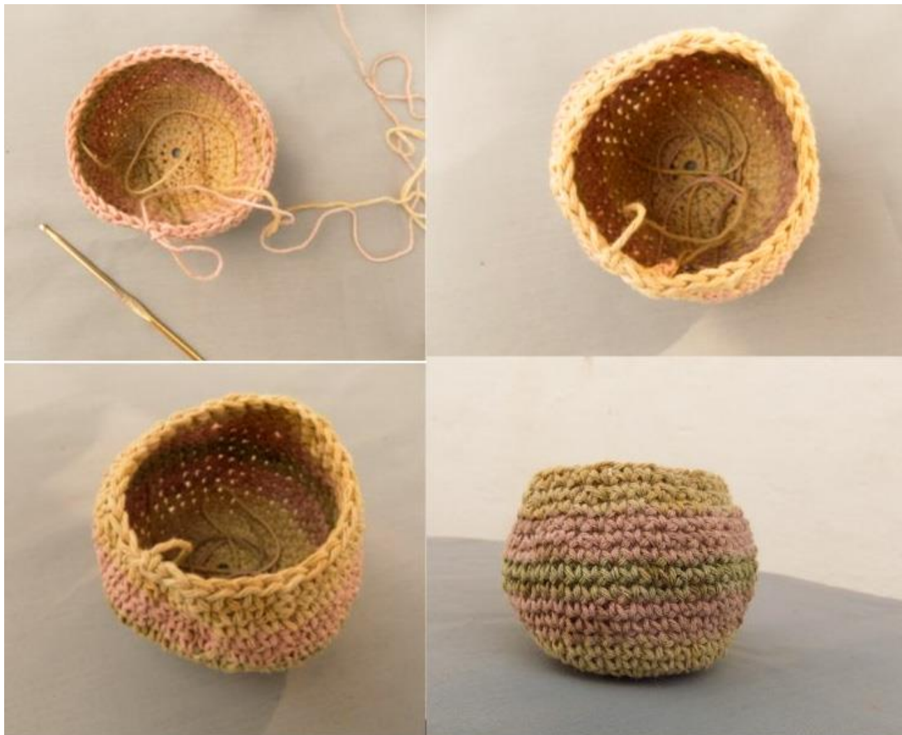
Secuencia del proceso de tejido de una vasija