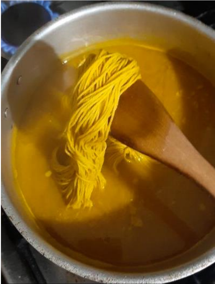
Teñido con cúrcuma