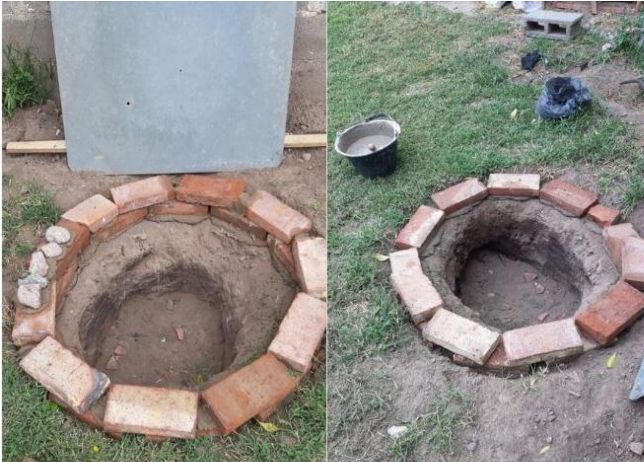
Creación del horno de pozo.