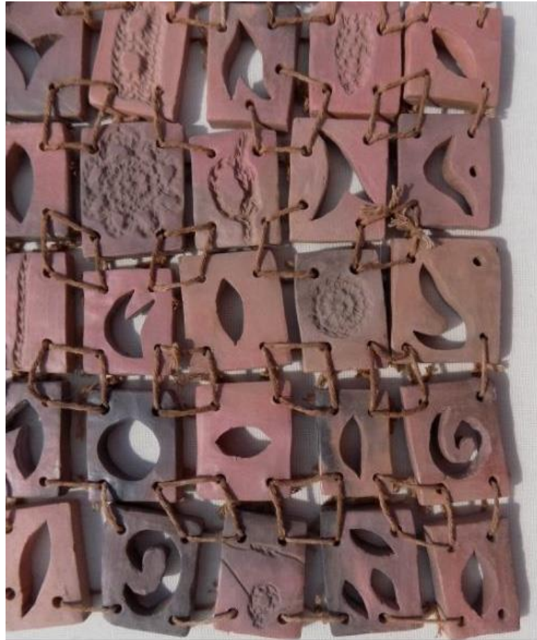
Detalle de manta