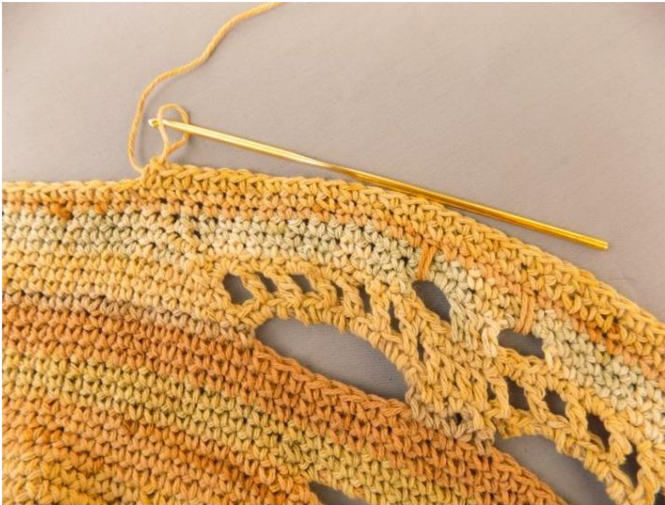
Manta circular: diferentes matices del teñido. Tramas y espacios.