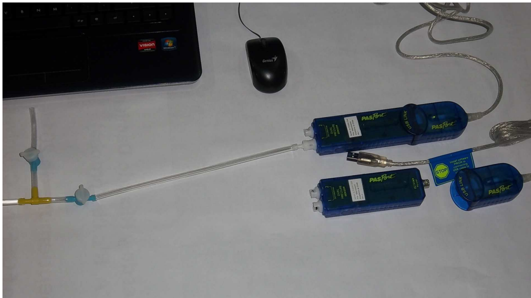
Figura 1. Recursos TICs sensores e Interfases Passport

Programa de Educación a Distancia Universidad Nacional de Córdoba Secretaría de Asuntos Académicos