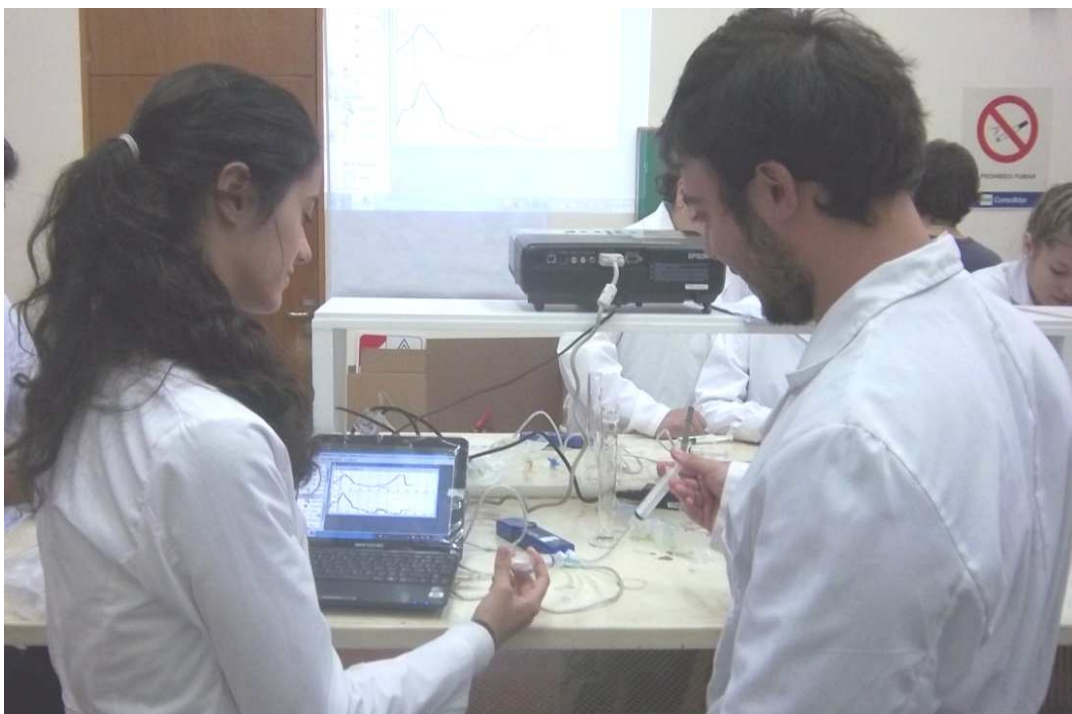
Figura 3. Estudiantes participando de los talleres.

En los tres espacios curriculares todos los jóvenes manifestaron haber trabajado en aulas virtuales pero desconocían la existencia y el uso de sensores multiparamétricos como así también los programas para procesar los datos que los sensores les aportaban.