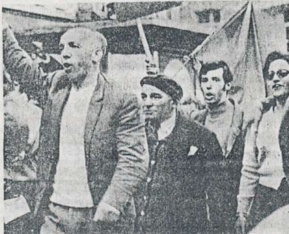
Manifestaciones en París de 1968: se revivió el glorioso espíritu de La Comuna.

Esto es, pues, lo que nos deja la Comuna: conquistas, ejemplos, modelos a seguir y una heroica experiencia. Un símbolo tal vez sea, entre tantos, el mayor del ejército Rossel diciendo: "El odio hacia quienes entregaron mi patria, el odio al viejo sistema, es lo que me ha impulsado a alistarme bajo las banderas de los obreros de París". El mayor Rossel fue uno de los que dirigieron las milicias populares de la Guardia Nacional de París, con gran valor y pericia militar, siendo después de la derrota fusilado por los verdugos de entonces—que hoy se llaman Pinchochet, Banzer o Quijada—, en noviembre de 1871 a los 27 años de edad.