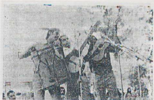
LOS NOCHEROS DE CORDOBA

Una animada concurrencia aplaudió a los artistas, que nos brindaron lo mejor de sí, y pusieron el broche de oro a esta fiesta de los mecánicos.