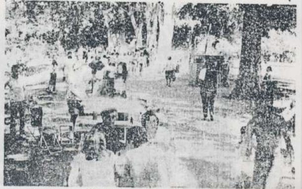
Pese a la gran cantidad de compañeros que concurrieron, todos encontraron donde acomodarse, en las enormes instalaciones del camping. Los nuevos asadores recibieron su bautismo de fuego.