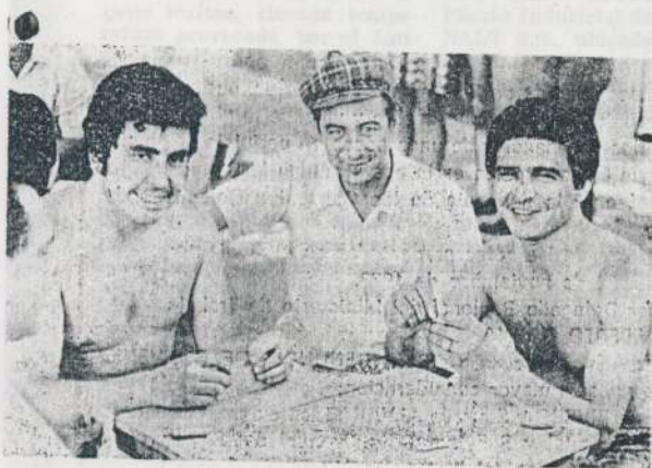
Una masa de truco. Por la cara parece que los dos han ligado.