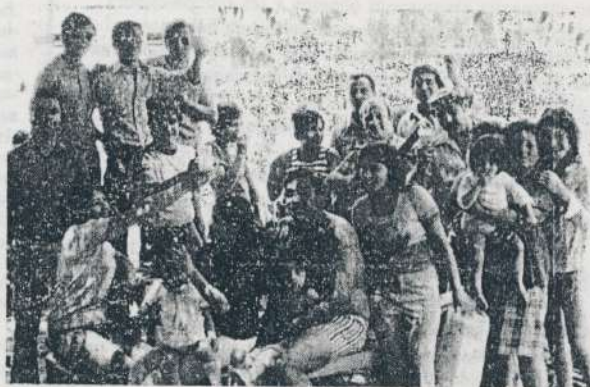
Un grupo de compañeros de Ilasa, con sus familiares, festeja el triunfo del equipo en el cuadrangular de fútbol.