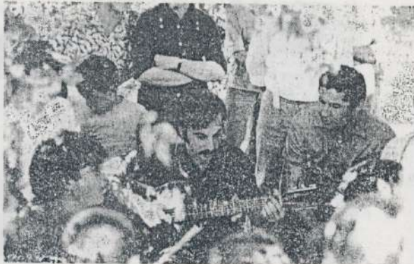
No faltaron tampoco las peñas, improvisadas bajo la sombra de los árboles.

El día, cálido y brillante, fue el marco en el que se des-