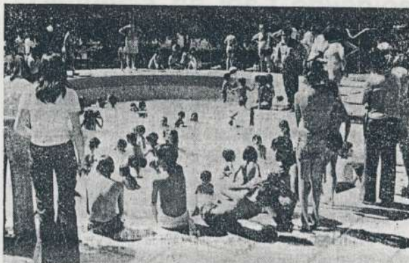
La pileta de los pibes. Bajo la atenta mirada de algún familiar y del bañero, los chicos juegan en el agüita fresca de la pileta destinada exclusivamente para ellos.

plegaron las más variadas actividades: un cuadrangular de fútbol (del cual informamos aparte), torneos de bochas y truco, juegos infantiles, mientras otros compañeros y compañeras disfrutaban del agua fresca de las piletas, o compartían con sus familias la alegría de estar juntos, en el seno de esa más grande, que nos abarca a todos, que es la familia mecánica.