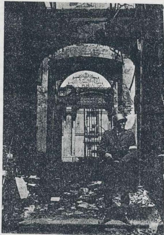
Casa de la Moneda, después del bombardeo reaccionario

En términos aproximados y esquemáticos, vamos a dar una idea de las fuerzas políticas que actuaron, siendo instrumentos y telón de fondo de un complejo proceso de lucha de clases. En el campo de la clase obrera y el pueblo, reunidos en la Unidad Popular, coalición que llevó a Allende a la presidencia en las elecciones de 1970, las mayores organizaciones fueron los Partidos Comunista y Socialista; ambos de vieja y sólida trayectoria en Chile, con un pasado heroico y gran respeto y arrastre de masas. Con ellos estuvieron el MAPU, grupo católico de izquierda, escindido de la Democracia Cristiana, y el Partido Radical, organización con cierto arraigo en parte de la clase media chilena, pero ya en decadencia. También hay que mencionar al Movimiento de Izquierda Revolucionaria (MIR), nacido en 1966 como grupo estudiantil y luego organización armada, que siempre propone esta vía; el MIR no