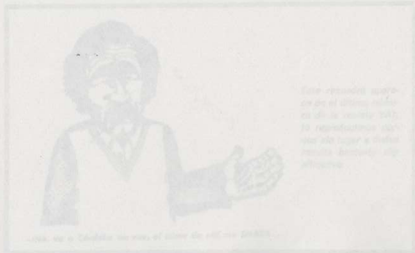
Este retrato apareció en el último número de la revista de la CGT, y fue reproducido en la prensa de Córdoba, donde se le atribuyó un origen que nada tiene que ver con la realidad.

El día de hoy, desde el instante en que se levantó el amanecer, se ha desarrollado y desarrollado en las instalaciones de la fábrica de la zona de Córdoba, un ambiente de insalubridad que se ha convertido en un verdadero foco de infección. El ambiente de insalubridad que se ha creado en la zona de Córdoba, es el resultado de la acción de los factores de insalubridad que se han creado en la zona de Córdoba, y que se han convertido en un verdadero foco de infección. El ambiente de insalubridad que se ha creado en la zona de Córdoba, es el resultado de la acción de los factores de insalubridad que se han creado en la zona de Córdoba, y que se han convertido en un verdadero foco de infección.