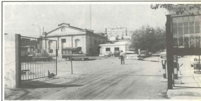
En el tema privatizaciones no seremos sujetos pasivos

En los otros casos, el SUOEM no abrirá juicio hasta que no existan proyectos concretos, pero es necesario, sobre esta cuestión, ratificar la posición que hemos expuesto en otras oportunidades: en todos los casos, vamos a defender de modo irreductible las fuentes de trabajo de