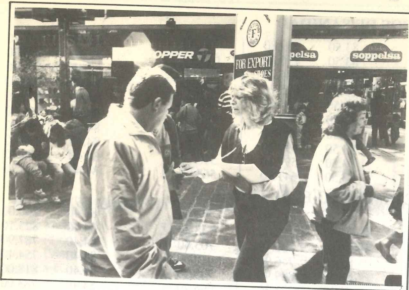
Dijimos nuestra verdad a la sociedad cordobesa.