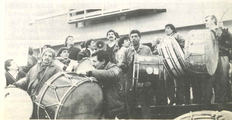
Los bombos también fueron protagonistas.