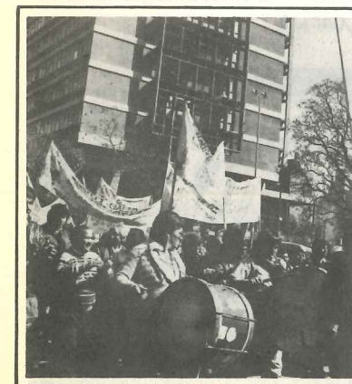
Los municipales en la calle, el Palacio solitario.