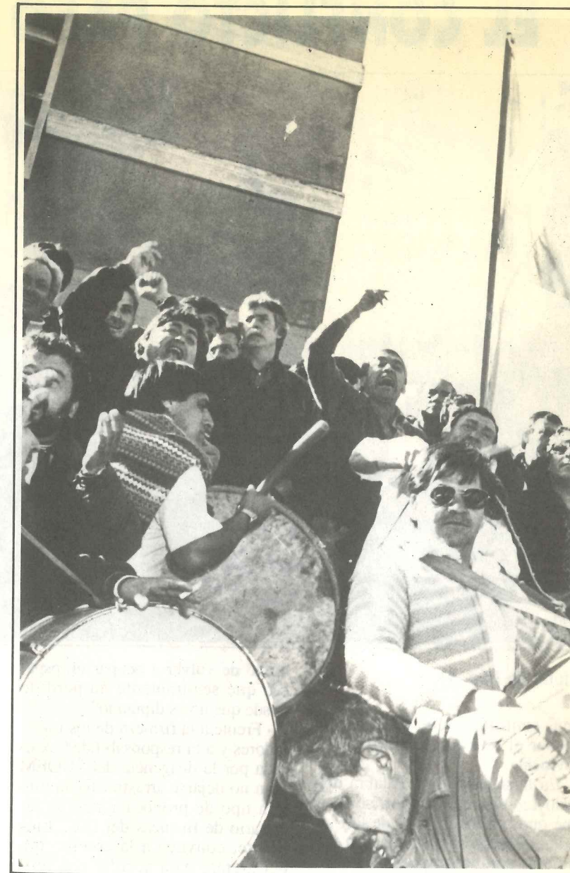
Dirigentes y activistas condujeron el proceso sin desmayos ni vacilaciones.

24 - La asamblea establece que las próximas medidas de fuerza se realizarán el 1 y el 2 de octubre.