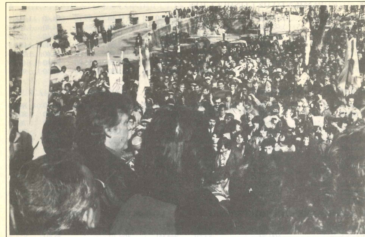
Los compañeros se movilizan en defensa del salario. El último ajuste se registró en febrero.

La asamblea general de los trabajadores municipales aprobó por enorme mayoría, durante la última jornada de paro, el acuerdo de cinco puntos suscripto entre el gremio y el Departamento Ejecutivo. En esa reunión, claro está, se informó detalladamente sobre la negociación realizada, pero creemos conveniente volver a repasar los puntos y formular precisiones en torno a algunos de ellos: