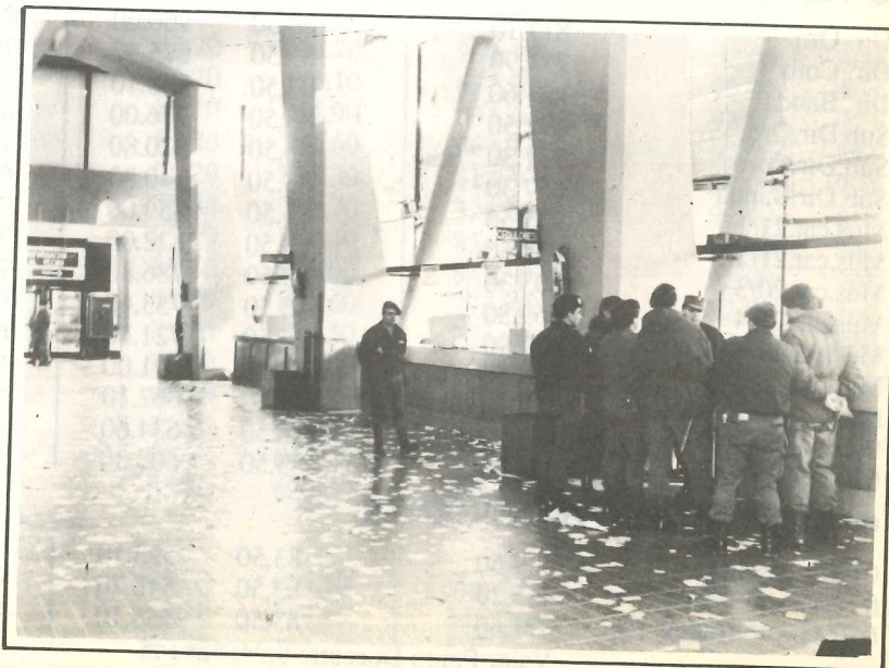
La abundancia de policías no contribuyó a dar soluciones.

18 - Se fija la fecha del 4 de setiembre para la realización de un paro general entre las 8 y las 24 horas, con movilizaciones desde los lugares de trabajo y una concentración en la explanada del Palacio 6 de Julio. A partir de ello, en los días siguientes, se desarrolla