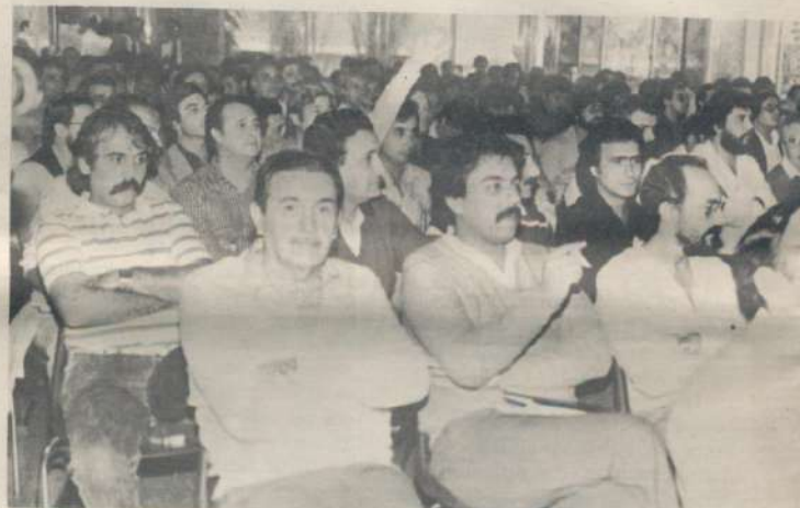
XIV Congreso Nacional Bancario. Mayo, en Tanti y diciembre en Mar del Plata. Nuestros Congresales reclamaron la vigencia del federalismo.