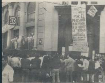
tierra de fuentes de bajo y los despidos en bancos privados utilizó la solidaridad de todo el gremio.