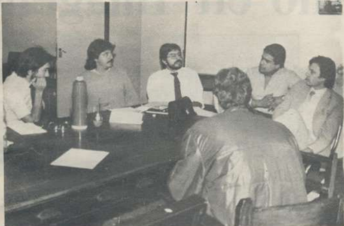
La Comisión de Bancos Privados, de reciente formación, en el tratamiento de su problemática