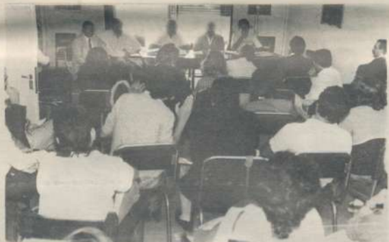
Todos los miércoles en reunión plenaria se debate la problemática gremial de los distintos bancos y la política gremial de nuestra Asociación.