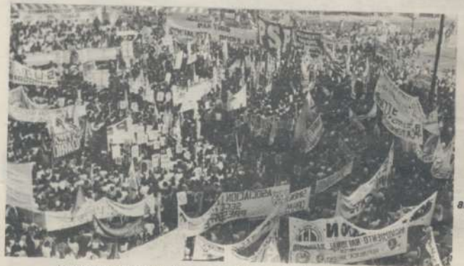
Los bancarios cordobeses presentes junto al movimiento obrero movilizado que reclama la restitución de sus derechos. Enero y Mayo de 1985 fueron dos hitos históricos de esta nueva etapa.