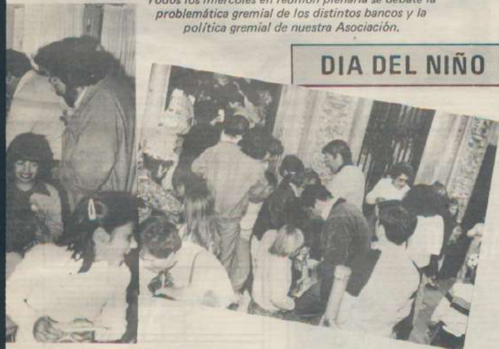
dad con los más postergados, Nuestra Instituto Pablo Pizzurno, ron su día con títeres, globos y os artísticos.