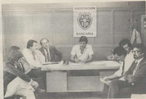
Junta Gremial Interna del Banco de la Provincia de Córdoba.

JUNTA GREMIAL INTERNA del Banco de la Provincia de Córdoba, que se hizo cargo de sus funciones a principios de Octubre de 1985.