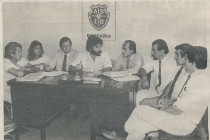
Comisión de Bancos Oficiales

"Entendemos que únicamente agrupándonos y dando una respuesta más contundente y cohesionada podremos conseguir logros que hoy por hoy se hacen más dificultosos dada la disper-