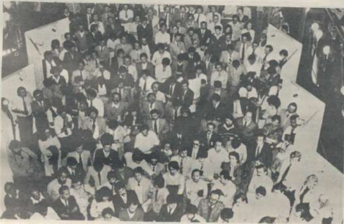
Abril y Octubre de 1985.- Los compañeros del Banco de Córdoba se movilizaron por sus reivindicaciones específicas. Una lucha que conjugó sinsabores y triunfos

13 de Diciembre de 1984.- El gremio vuelve a manos de los trabajadores bancarios. Después de la contienda electoral un nuevo llamado a la unidad y la participación.