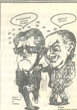
Angeloz no cumple con las leyes votadas por sus propios legisladores!!