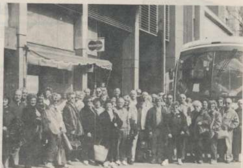
El contingente que viajó el domingo 6 de Octubre a Mar del Plata.

A Cataratas del Iguazú, Brasil, Paraguay parten 96 jubilados a fines de Octubre, y la misma cantidad irá a Mendoza y Chile en Noviembre y