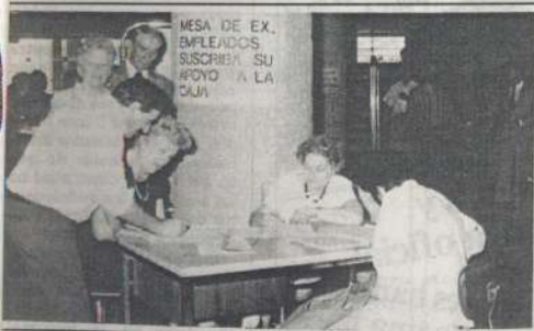
Campaña de recolección de firmas en la Caja Nacional de Ahorro y Seguro, que llevaron adelante los jubilados de la histórica institución.