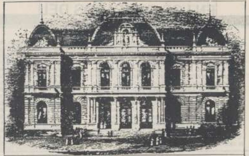
Reproducción del dibujo original de la fachada del Banco de la Provincia de Córdoba de los planos del