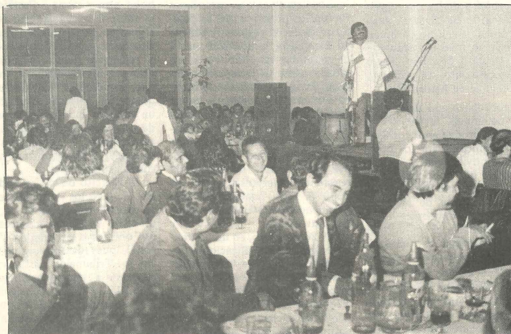
Desde ahora el gremio ofrece un nuevo servicio a sus afiliados.

C on un agasajo del que participó un elevado número de compañeros municipales, el SUOEM dejó inaugurado, la noche del 24 de mayo, el comedor sindical que ahora presta servicios a los afiliados en 27 de Abril 739. Al acto asistieron dirigentes de gremios hermanos y otros invitados.