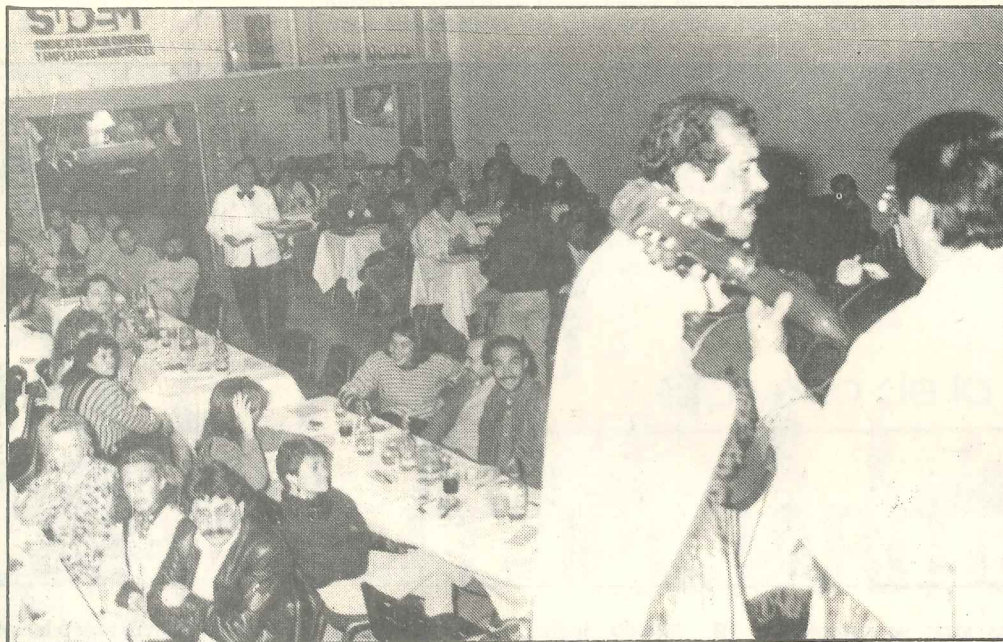
Un aspecto de la noche de la inauguración del comedor sindical