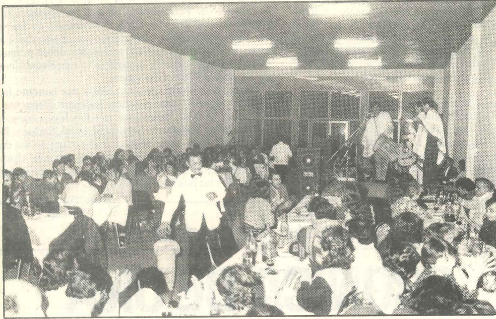
Los compañeros municipales tuvieron un animado show