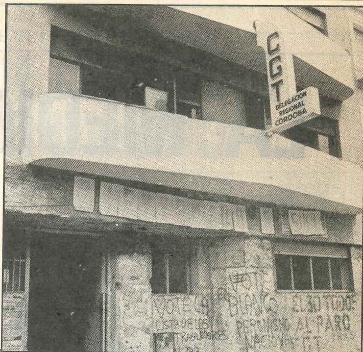
Una CGT unificada es base imprescindible para sostener las reivindicaciones de la clase trabajadora.

Frente a esta dramática realidad, hay dirigentes que sostienen que el futuro secretariado de la CGT normalizada debe estar dotado de "cohesión ideo-