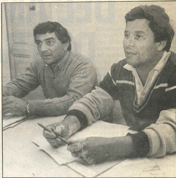
Delegados Guzmán y Salcedo: hay cosas para cambiar en los cementerios.

En el mismo contexto, ambos delegados recordaron que en fecha reciente todo el personal, incluyendo el administrador y los jefes, colaboró con una rifa que posibilitó la adquisición de dos heladeras, una en el Cementerio San Vicente y otra en el Cementerio Parque, que permite a los compañeros contar con agua potable y fresca. "La Secretaría de Gobierno