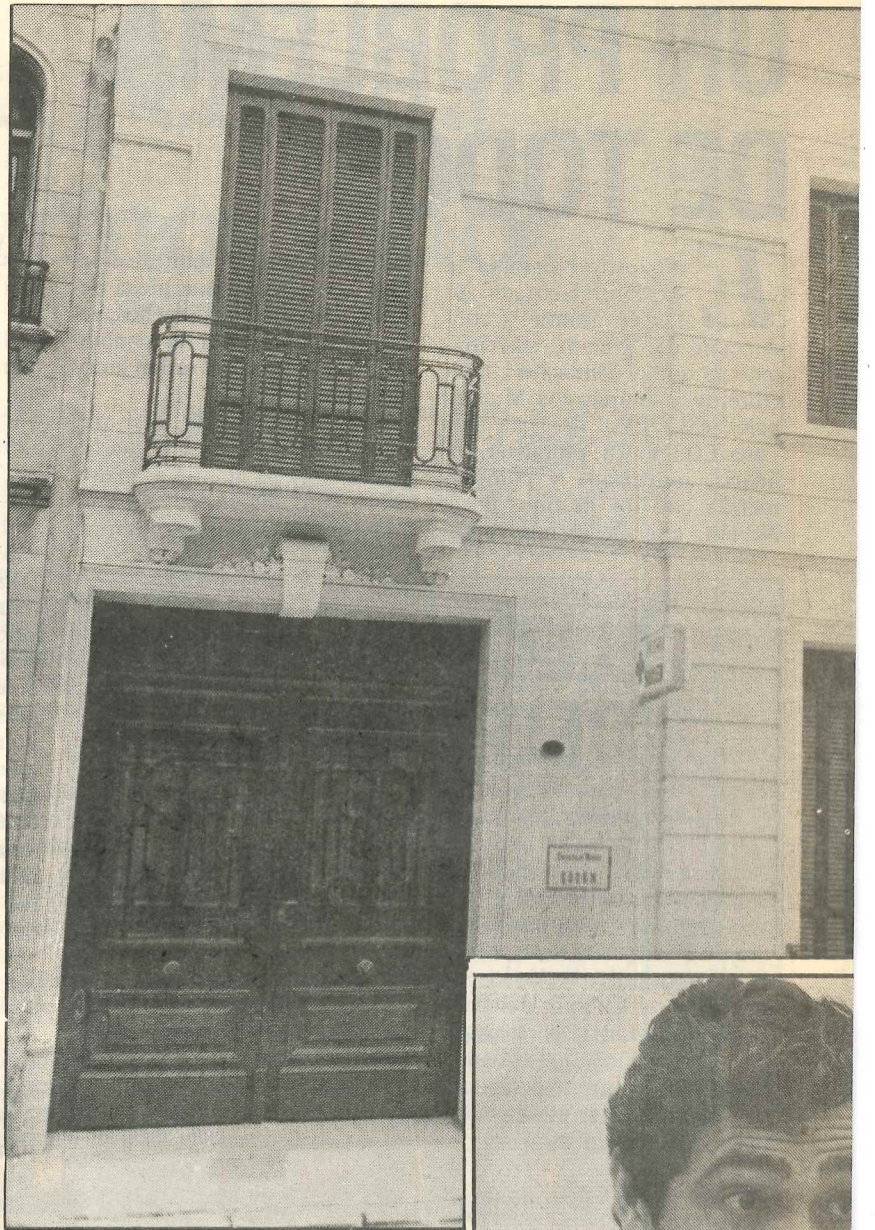
Los consultorios del SUOEM cubren necesidades de los afiliados supliendo las deficiencias de un sistema inadecuado.