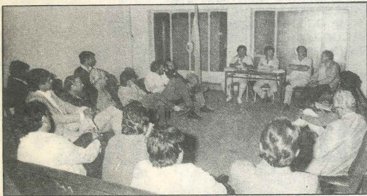
En el SUOEM un plenario gremial debatió el problema de los compañeros de Luque.

un corte definitivo a una situación que es incompatible con la existencia de un sistema democrático.