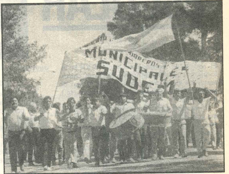
Protesta popular en las calles de Luque.

Por otra parte, el Cuerpo General de Delegados del SUOEM ratificó su apoyo y so-